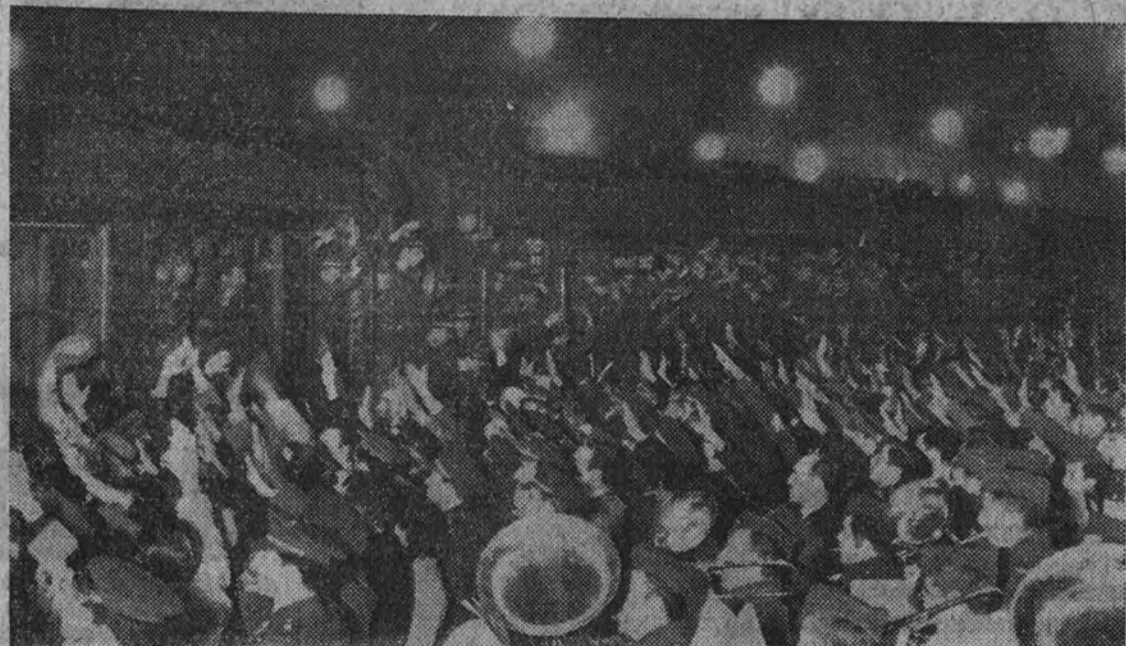
La banda de las Fuerzas Aéreas interpretó el himno de la Falange, que fué cantado por el público en el momento de arrancar el tren en que marchó a Alemania el segundo grupo de la Escuadrilla Azul