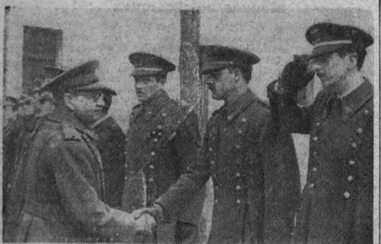
El ministro del Aire, general Vigón, despidiéndose de los pilotos que parten para Rusia.