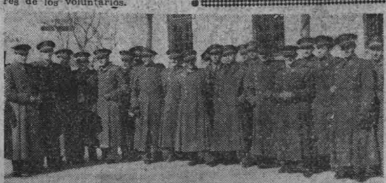
Grupo de pilotos que forman en la Escuadrilla momentos antes de la partida

"A pesar de la contraofensiva rusa, el Eje conserva una inmejorable posición estratégica"