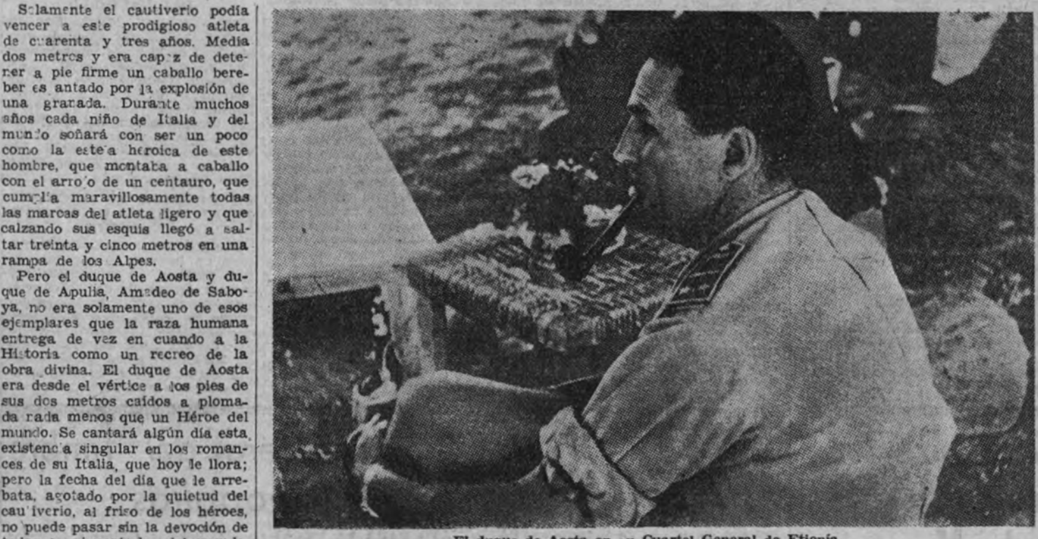
El duque de Aosta en su Cuartel General de Etiopía

Su comportamiento heroico en Amba-Alaghi despertó la admiración de sus propios enemigos