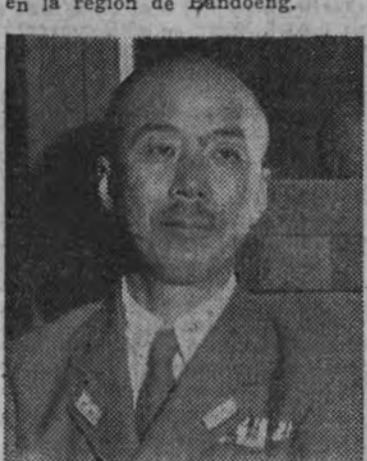
El general Shojiro Iida

nes en Java, verificado el 1 de marzo. A continuación comienzan a conocerse detalles del hecho. El general que manda las fuerzas japonesas se llama Hitoshi Imura. Las tropas holandesas, al rendirse, han obedecido las órdenes del gobernador de la isla, Van Starckenborgh, que decidió la rendición tras una conversación con el jefe de las fuerzas y después de haber sido rechazada por los japoneses una propuesta de cesación de hostilidades únicamente en la región de Bandoeng.