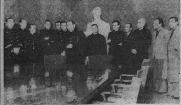
El ministro Secretario del Partido, camarada Arrese, con los alumnos de la Escuela de Capacitación Social que le visitaron ayer en su despacho

El ministro terminó compendiando los puntos fundamentales, a conseguir en los siguientes: Revolución espiritual, lucha contra el marxismo y el capitalismo, y empuje, y decisión en todo para conseguir la enorme tarea a desenvolver en tiempo y en intensidad.