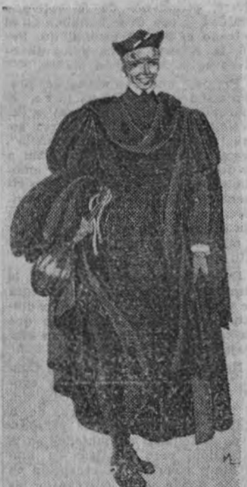
Reproducción del verdadero traje tradicional de nuestros universitarios