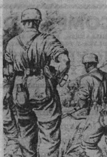
"Paracaidistas en Creta"

Encauado en las Compañías de Propaganda, el artista comparte todos los riesgos de la campaña; se halla siempre en los lugares que habrán de ser de gloria. Así están esos apuntes de Narvik y de Creta tomados por Kretschmann, caído, como Hess y Erdmann, en el frente del Este; dibujos de vivos contornos y fuerte luminosidad y retratos de apretado estudio con pinceladas nevadas al fondo. En su cuadro "Cura de urgencia", de técnica analítica a la empleada en el retrato del capitán Schoenbeck, parece resumirse la capacidad pictórica y el sentido monumental de la forma de este glorioso artista. Figura destacada es también la del dibujante Willich, autor de los magníficos retratos del coronel comandante Deenitz y del general Rommel y Strauss, de modelado, de plástica, enérgico y vivo, expresando la capacidad y viva expresión de los aspectos más violentos y dinámicos de la guerra, están tratados con desenvoltura y profundo claroscuro en las obras de Lipus, Matelko y Janesch; mientras que la vivacidad, casi meridional, de Doherr y la fina