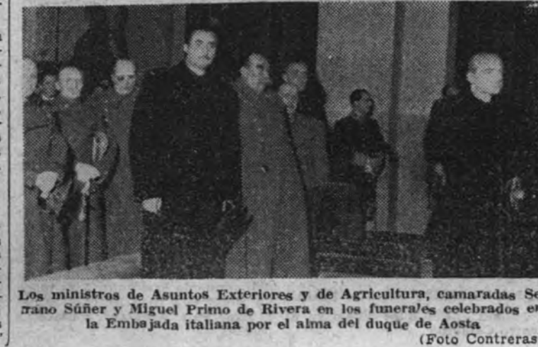
Los ministros de Asuntos Exteriores y de Agricultura, camaradas Serrano Suñer y Miguel Primo de Rivera en las funerales celebradas en la Embajada italiana por el alma del duque de Aosta.