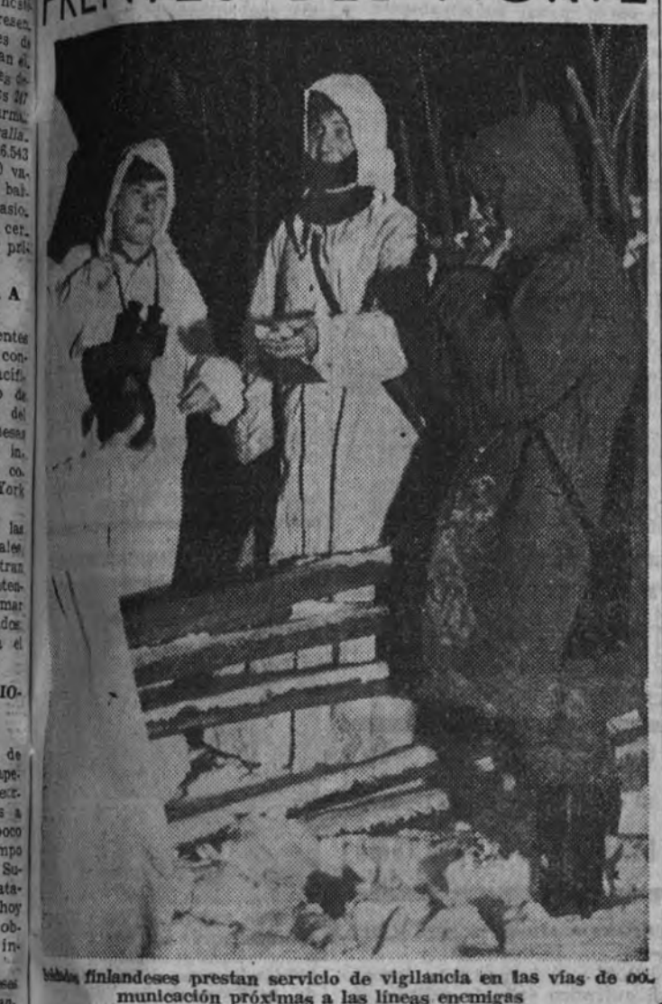
Finlandeses prestan servicio de vigilancia en las vías de comunicación próximas a las líneas enemigas.