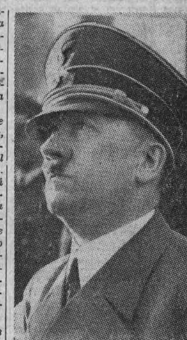
Historia juzgará con una sentencia que será tanto más grave cuanto menos se detenga en procesales bizantinismos.