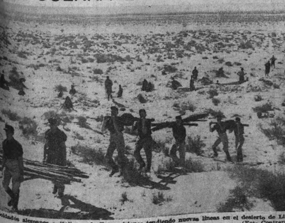
Soldados alemanes e italianos de Transilvania tendiendo nuevas líneas en el desierto de Libia