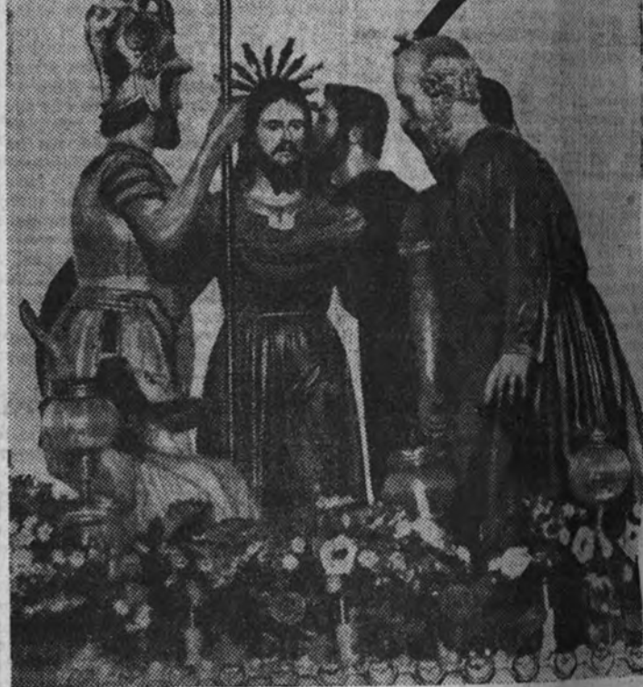
"Paseo" titulado El beso de Judas

Este año, como premio a tantos esfuerzos y tan sincero fervor, será la Semana Santa en Crevillente algo excepcional y maravilloso. Fieles de todos los pueblos de la provincia, así como del resto de España, acudirán a esta ciudad para presenciar las típicas y emocionantes fiestas, que serán,