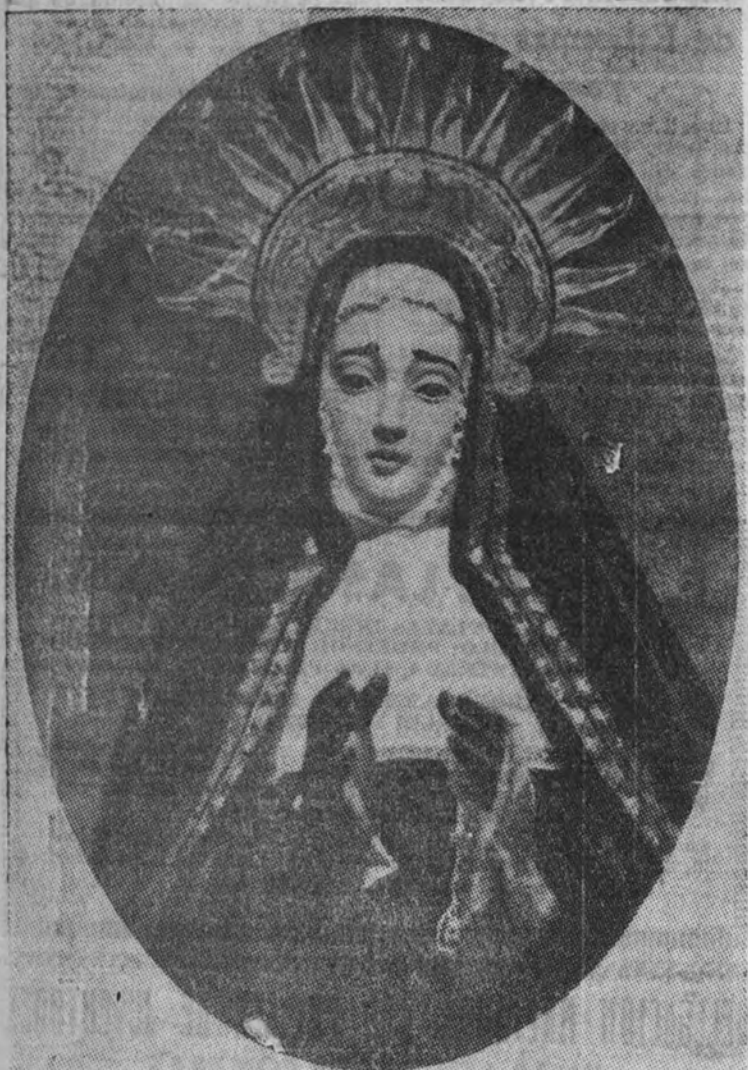
La Soledad, imagen muy venerada en Crevillente

Crevillente cuenta también con una de las más importantes fábricas de medias que honran a