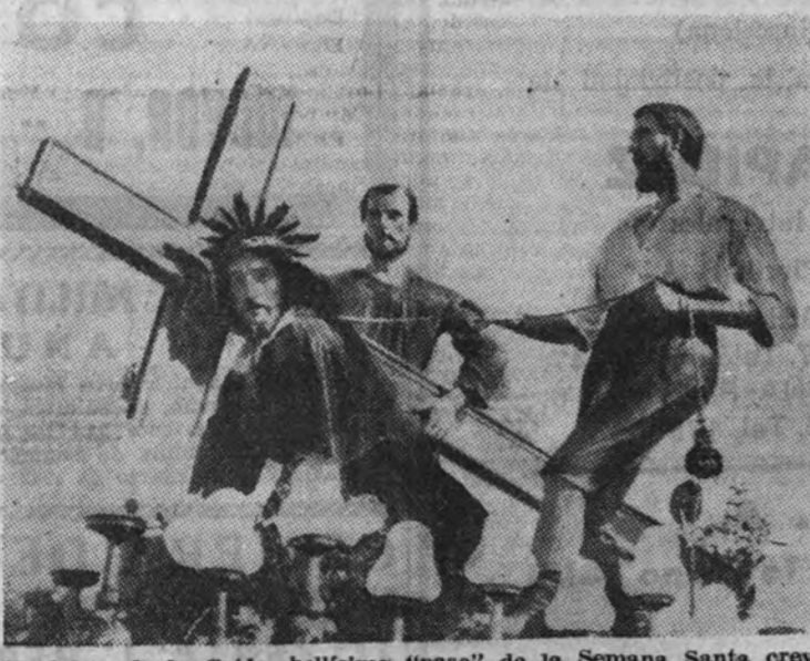
El Cristo de la Caída, bellísimo "paseo" de la Semana Santa crevillentina

Uno de los gremios más castigados era el de albañiles. Hoy disfrutan de un aumento en sus jornales del 75 por 100, y, además, disfrutan también de subsidio, vacaciones y festividades, debido a que la Sección de Albañilería figure como empresarios, por el hecho de no existir éstos en Crevillente.