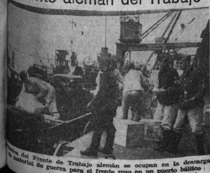
El material de guerra para el frente ruso en un puerto báltico.