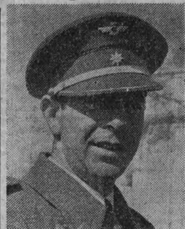
El jefe de la Escuadrilla