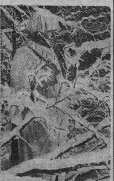
Confundido con la nieve, merced a su blanco capote, este soldado alemán presta servicio de centinela en un puesto avanzado del frente ruso a muchos grados bajo cero.