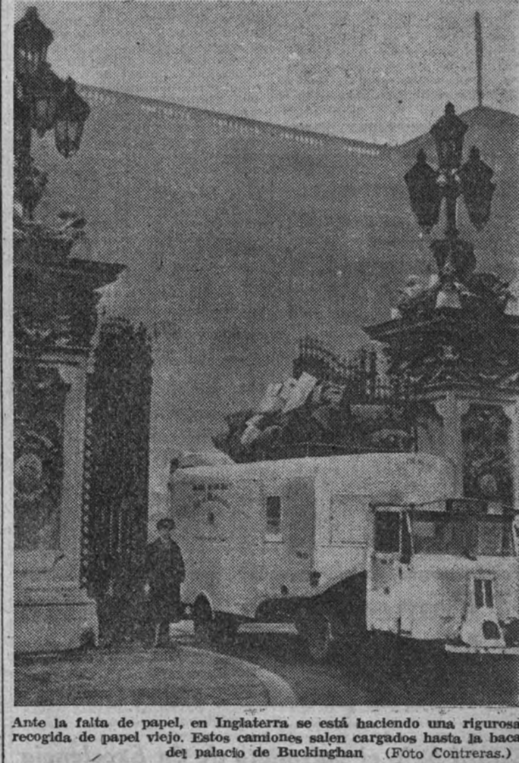
Ante la falta de papel, en Inglaterra se está haciendo una rigurosa recogida de papel viejo. Estos camiones salen cargados hasta la boca del palacio de Buckingham.