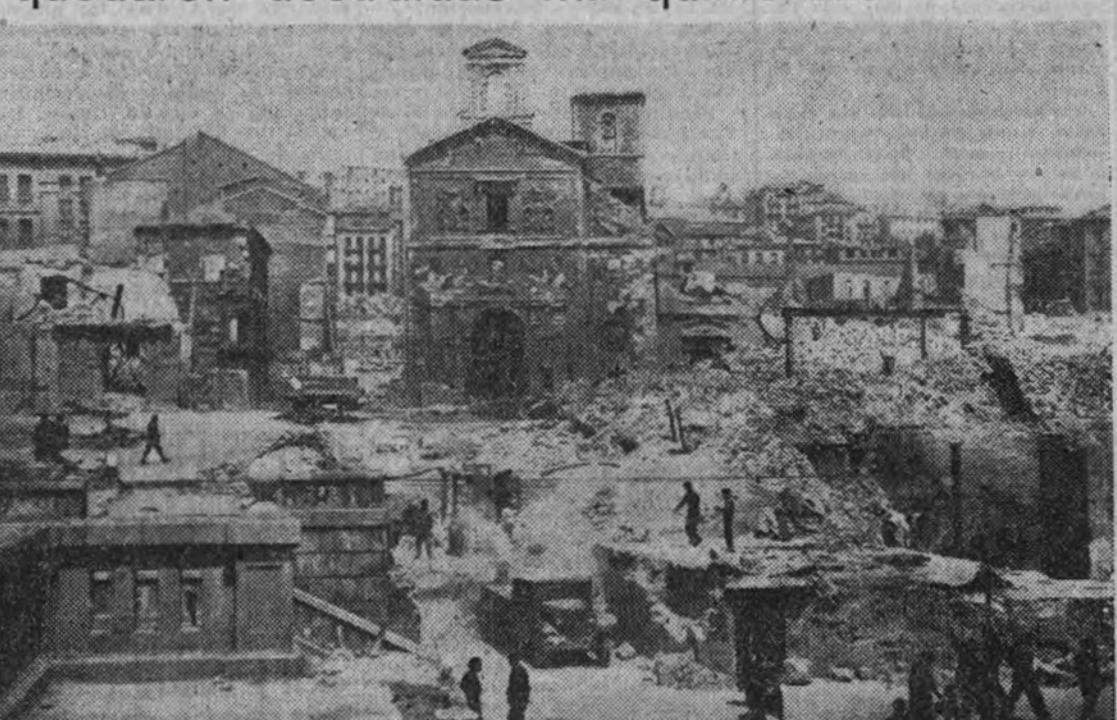
La Iglesia de la Compañía de Jesús antes de las obras de reconstrucción

Proximamente se dará a conocer la relación completa de los premios y los concurrentes. Se recuerda a los concurrentes que el punto de partida de las bases, que determinan el plazo de admisión de obras, es el día 18 de febrero y terminará el día 18 de marzo.