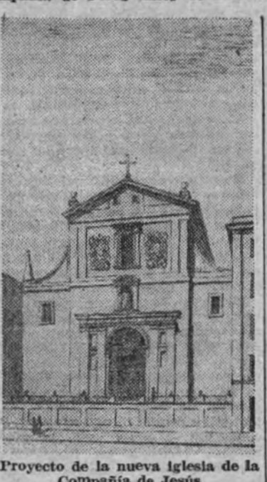
Proyecto de la nueva Iglesia de la Compañía de Jesús

trucción de un nuevo Palacio Episcopal, que oculte la vista de la torre y la fachada oeste de la catedral, adosando el edificio de suerte que pueda tener fácil comunicación desde el Palacio.