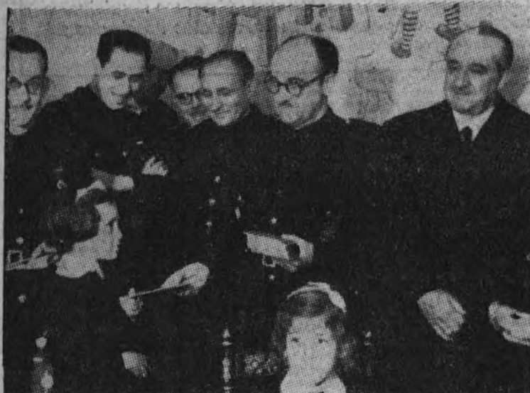
El delegado nacional de ex cautivos entrega libretas de ahorro a las educandas.

En él recibirán educación 122 huérfanas de ex cautivos de los rojos