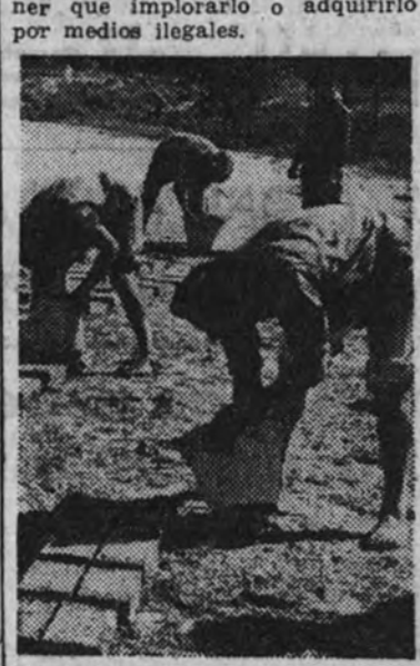
Mendigos trabajando en la fabricación de ladrillos

Jununtamente con los trabajos de huerta y secano—la finca tiene también algo de viñedo—se montarán pequeñas granjas de ganado, en las que los mendigos que emplearán los músculos de los mendigos callejeros, que saldrán de esta colonia agrícola regenerados y sabiendo ganar su sustento sin tener que implorarlo o adquirirlo por medios ilegales.