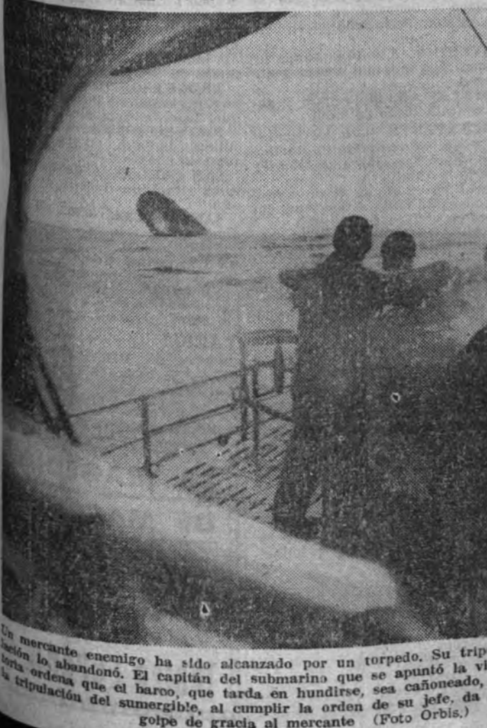
Un mercante enemigo ha sido alcanzado por un torpedo. Su tripulación ha abandonado. El capitán del submarino que se apunta la victoria ordena que el barco, que tarda en hundirse, sea cañoneado, y la tripulación del sumergible, al cumplir la orden de su jefe, da el golpe de gracia al mercante.