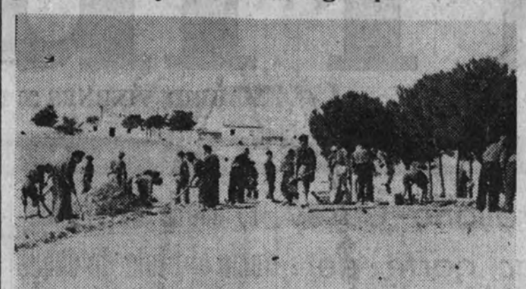
Mendigos recogidos en la colonia municipal trabajando en las faenas del campo

Será dedicada a colonia agrícola para reintegrar al trabajo a los mendigos profesionales