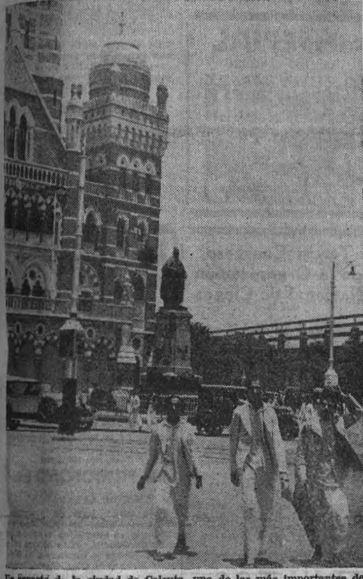
Un aspecto de la ciudad de Calcuta, una de las más importantes de la India, sobre cuyo territorio se cierne la amenaza de la guerra.