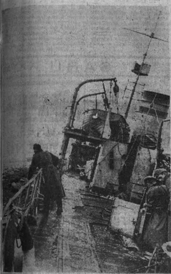
Almuerzo visitando un minador soviético destruido en el mar Negro por las baterías del Ejército del Reich

Cien mil obreros muertos, 550.000 inutilizados 460 millones de jornadas de trabajo perdidas en la industria de guerra de los Estados Unidos