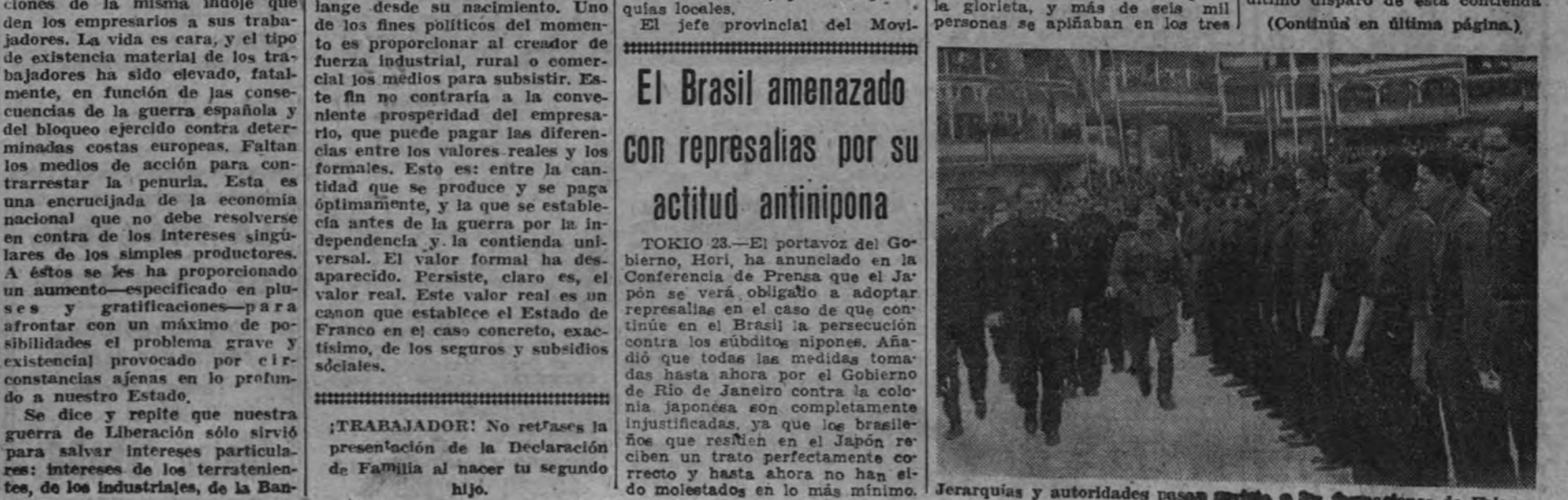
Jerarquías y autoridades pasan revista a las formaciones de Falange