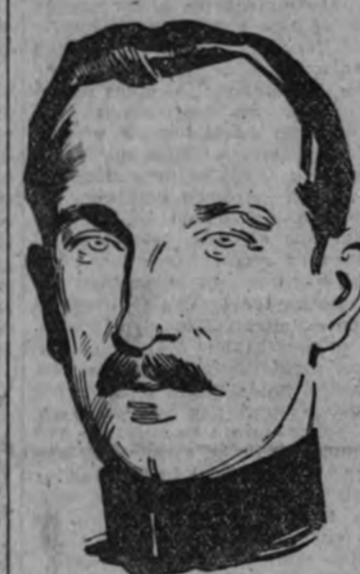
El rey de Bulgaria, a Alemania

El jefe provincial del Movimiento pronunció las siguientes palabras: "Nada más grato para los ojos de un jefe que una formación castrense con uniformes, banderas y cornetas. Ante ese pequeño ejército, en el que os ve hombre con uniforme, observo, sin embargo, las negras salvedades, y los rostros laureados con las hojas rojas del martirio." Recomienda la seriedad para los pasos decisivos de la Revolución nacional. Hizo un canto a la patria.