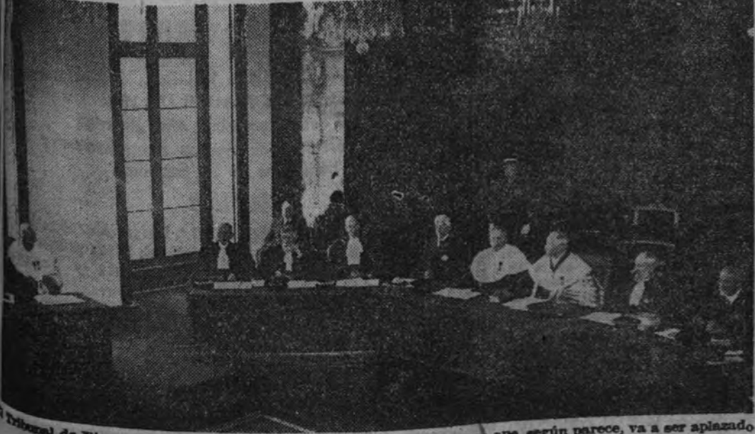
El Tribunal de Riom, durante una de las primeras sesiones del proceso que, según parece, va a ser aplazado.