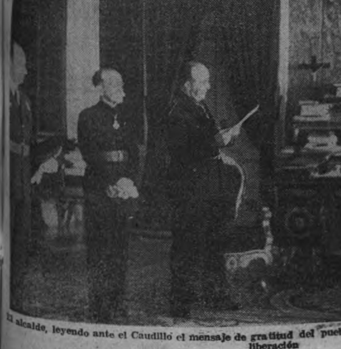
El alcalde, leyendo ante el Caudillo el mensaje de gratitud del pueblo madrileño en el aniversario de la liberación.

Al discurso de antayer hemos de volver nuevamente en sucesivos comentarios. Pongamos hoy como iniciación este contraste entre dos políticas. Hemos arrebatado militarmente una bandera porque nos correspondía, no sólo por derecho imprescriptible de nuestro entronque histórico con el pasado español, sino también porque no hemos hecho de ella un ofensivo pabellón de piratería, sino que la hemos clavado sobre la dramática existencia en que dejaron al pueblo hispano aquellos que hoy se burlan desde lejos de su hambre y de su sacrificio.