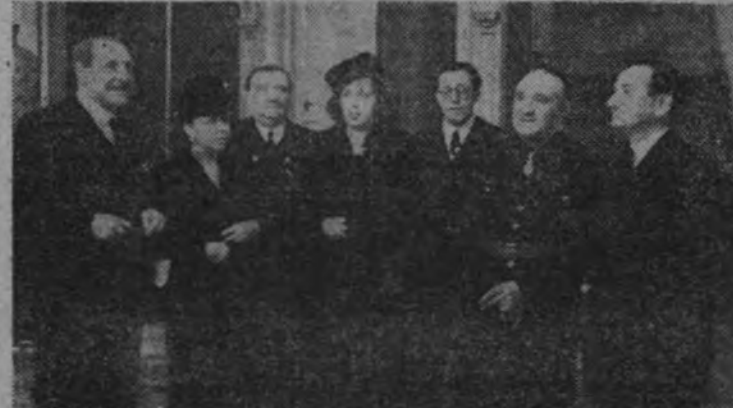
Los ministros Secretario general del Partido y de Obras Públicas, con el alcalde y otras personalidades, en la recepción del Ayuntamiento

Los ministros Secretario general del Partido y de Agricultura, con el vicepresidente de Educación Popular, el jefe provincial del Movimiento y gobernador civil, el presidente de la Diputación y otras jerarquías y personalidades, en la recepción del Ayuntamiento