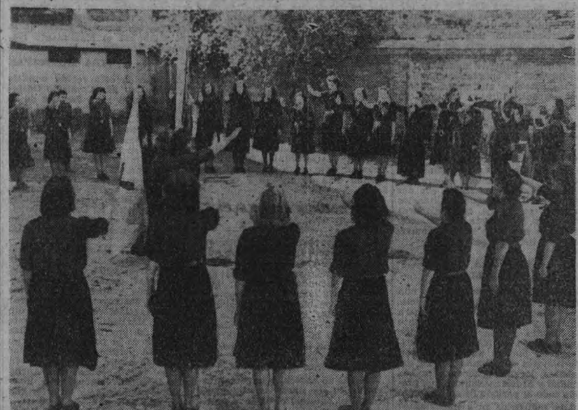
Las cursillistas cantando el "Cara al Sol" al arriar banderas.

El jefe provincial señaló la influencia de la mujer en la Revolución Nacional sindicalista