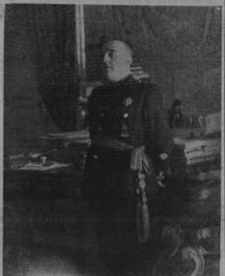
El Caudillo pronunciando su discurso en contestación al mensaje del pueblo de Madrid, transmitido por su alcalde.

Y de cumplirlas venimos en este momento. De nuestra tarea co-