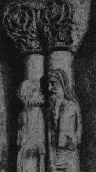
Sobre paredes columnares aparecen en la Cámara Santa singulares escenas de los apóstoles, que sufrieron la destrucción roja, y que hoy han sido totalmente restaurados.

Ultimas representaciones en el Teatro ESPAÑOL