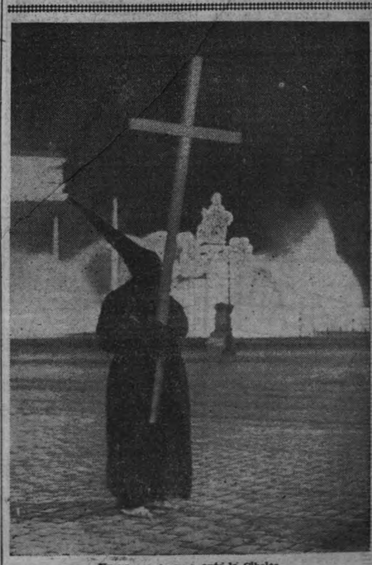
Un nazareno cruza ante la Cibeles