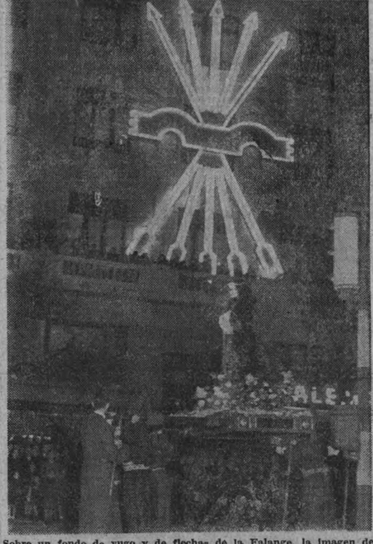
Sobre un fondo de yugo y de flechas de la Falange, la imagen de Jesús Nazareno avanza por la calle de Alcalá, en la procesión del Silencio.

La procesión del Silencio, con su belleza plástica y la emoción litúrgica de la Pasión, devuelve a la Iglesia española el fuero y privilegio sobre las almas, los seres, las calles y las plazas madrileñas. Ralé del Movimiento, impulsora de la Falange, la Verdad católica inspira sobre la urbe capitalina y la nación entera. En el cálculo matemático de los centenares de millares de madrileños que asistieron a la procesión del Silencio, no descontaremos a nadie, porque en todas las almas prende o puede prender la fe. Los que anoche salieron a las calles de Madrid han logrado o lo conseguirán un entendimiento perfecto de la existencia humana. La multitud postizada, sencillamente, al paso de las imágenes santas; la muchedumbre sumida en los senos hondos del silencio representa el mayor espíritu de todos los pueblos. Cristo, al pasar por la Puerta de Alcalá, figurado en una escultura ecuática, tan impresionante como las tallas de viejo linaje artístico, se agigantaba. Sus brazos tendidos a la cruz parecían—y así era en verdad—abarcarse a la muchedumbre, comprender a todo Madrid. En el altísimo que hace más de siglo y medio fué el límite amurallado de la capital, Cristo abrazaba a todos, creyentes y tibios, descreídos y maldicientes.