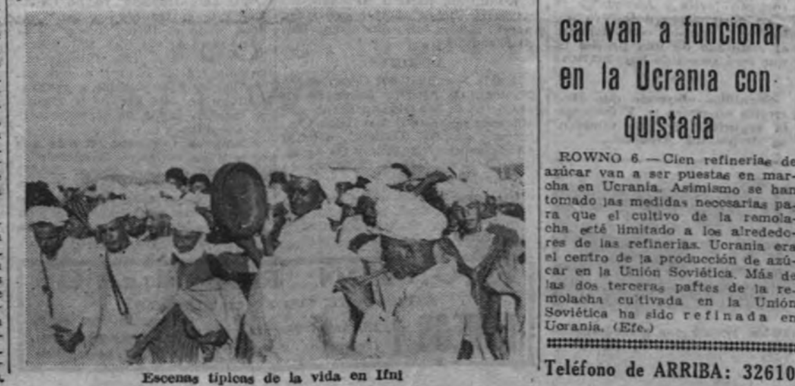
Escenas típicas de la vida en Ifni

Las "yamásas" se reunieron para deliberar, y a la mañana siguiente comunicaron al coronel