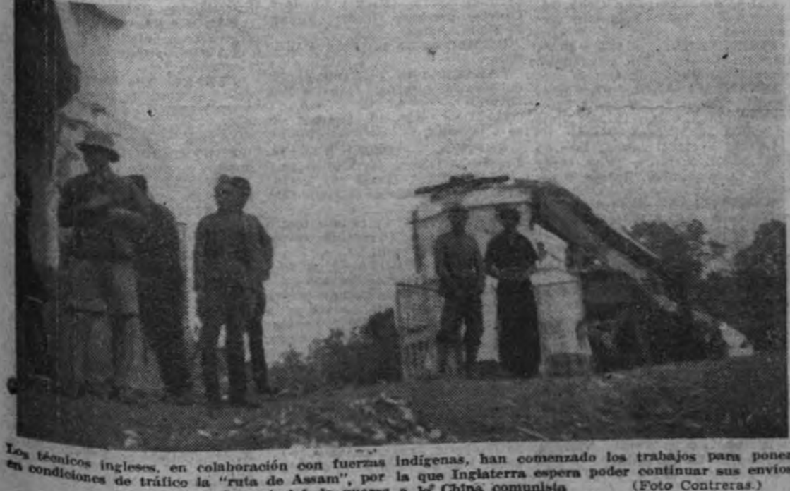
Los técnicos ingleses, en colaboración con fuerzas indígenas, han comenzado los trabajos para poner en condiciones de tráfico la "ruta de Assam", por la que Inglaterra espera poder continuar sus envíos de material de guerra a la China comunista