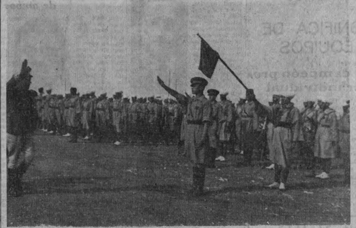
Un batallón de tiradores de Ifni durante una revista

Sus hombres han combatido en nuestra guerra bajo las banderas gloriosas de los "tiradores de Ifni"