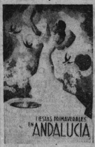
El cartel de la feria de Sevilla

SEVILLA 6.—Se aceleran los preparativos para el montaje de la feria, y en el Prado de San Sebastián han empezado a trabajar hoy, lunes, nuevos equipos de obreros especializados. La feria ocupará aproximadamente, la misma extensión que en años anteriores, aunque la zona destinada a instalación de las casetas típicas resultará un poco más amplia. También tendrá bastante extensión la parte dedicada a instalaciones industriales y recreativas. Para la campaña de ópera, que comienza el próximo día 8, existe gran animación. El tenor Felipe, con otros cantantes de primera categoría, llegará mañana. El tiempo se mantiene muy bueno; luce el sol y el clima es casi caluroso. (Cifra.)