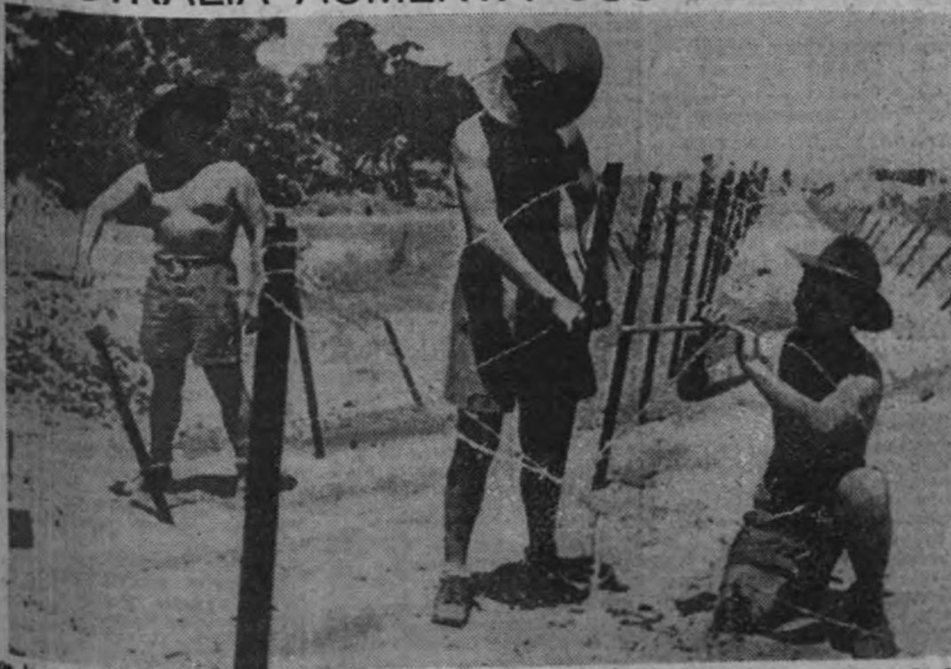
Los incontestables avances de los ejércitos nipones obligan a los mandos de Australia a reforzar la defensa del Continente