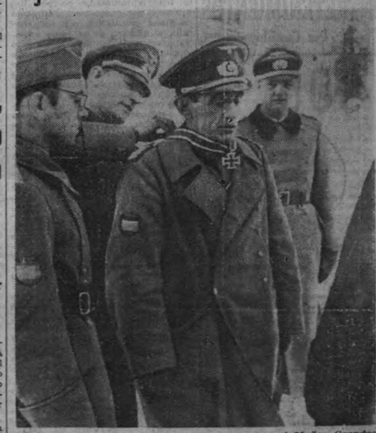
Momento emocionante de serle impuesta al general Muñoz Grandes, jefe de los combatientes españoles que luchan contra el comunismo, la Cruz de Hierro de primera clase, ganada en el campo de batalla frente al enemigo de la Humanidad.