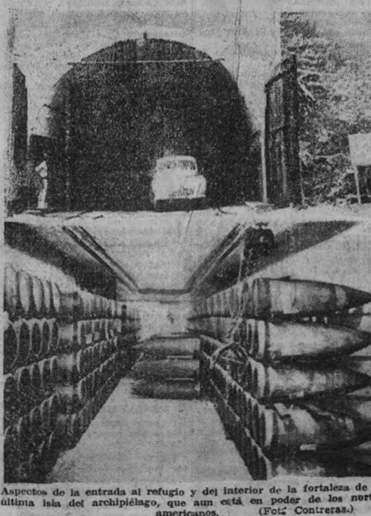
Aspectos de la entrada al refugio y del interior de la fortaleza de la última isla del archipiélago, que aun está en poder de los norteamericanos.

Acechan los submarinos de una y de otra Flota el paso de los convoyes: los sumergibles alemanes, de los convoyes que han zarpado del norte de Escocia; los rusos, el de los que se deslizan desde Frondhjen y las islas Lofoden hacia Petsamo, y el frente final. El Reich singularmente vigila allí