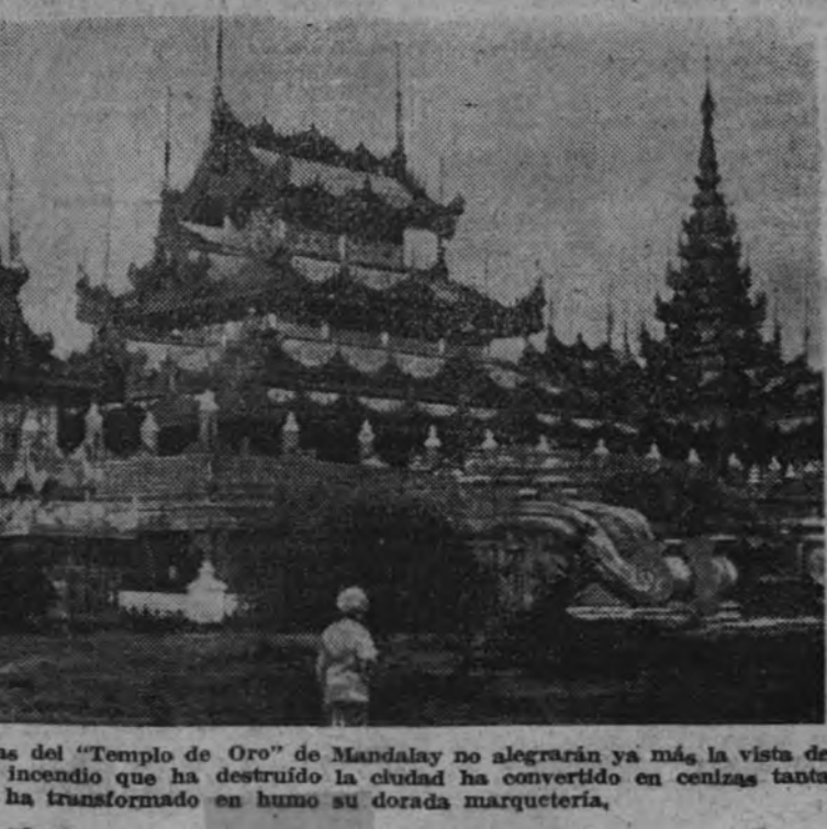
Estos calados pináculos y torrecillas del "Templo de Oro" de Mandalay no alegrarán ya más la vista de sus visitantes ni de sus fieles. El incendio que ha destruido la ciudad ha convertido en cenizas tanta alada belleza y ha transformado en humo su dorada marquetaria.