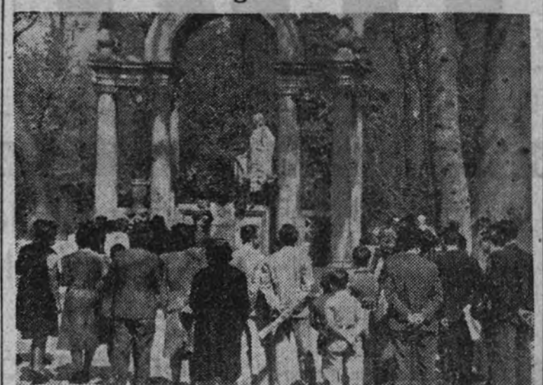
Homenaje a la memoria de Serafín Álvarez Quintero ante el monumento del Retiro en el aniversario de su muerte.

El domingo se cumplió el quinto aniversario de la muerte del ilustre comediógrafo D. Serafín Álvarez Quintero. Durante todo el día fue incesante el desfile de personalidades y público ante el monumento erigido en el Retiro a los hermanos Álvarez Quintero.