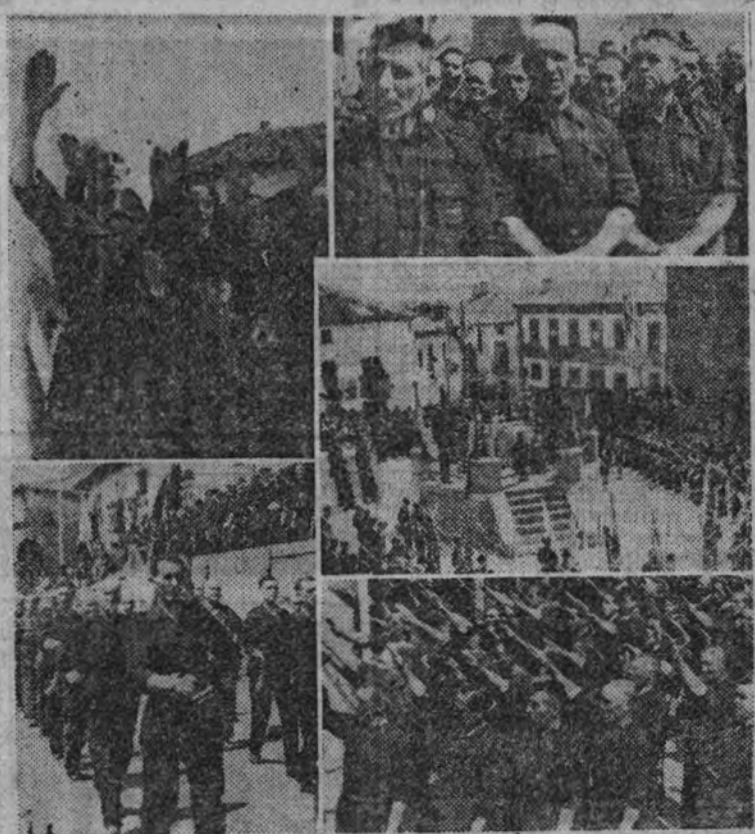
Varios aspectos de la concentración camorral celebrada en San Martín de Valdeiglesia

El pasado domingo se celebró en San Martín de Valdeiglesia, con gran entusiasmo, una concentración camorral falangista, en la que tomaron parte 5.000 camaradas, en representación de la Falange de todos los pueblos que integran aquel partido.