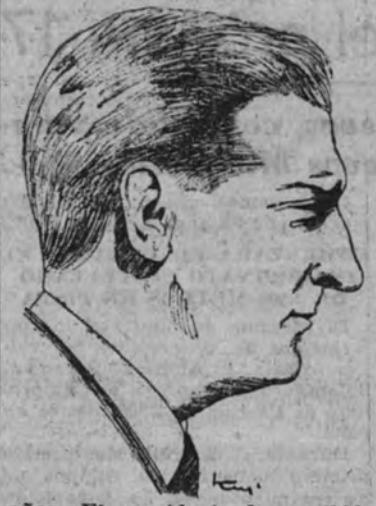
años. El presidente ha recibido numerosos telegramas de felicitación de todas las provincias y colonias portuguesas. (Efe.)

"Si ya ahora, en medio de la guerra, se trata de abolir la esclavitud instituida por el bolchevismo—declaró el ministro—, se han animado los esfuerzos necesarios para reparar los daños causados por el sistema opresor de Moscú. Pero esto dependerá también de la población de las regiones ocupadas. Así los planes de reconstrucción podrán realizarse con éxito, para que después de veinte años de terror judío y bolchevique los campesinos puedan al fin gozar de los frutos de su propio trabajo."