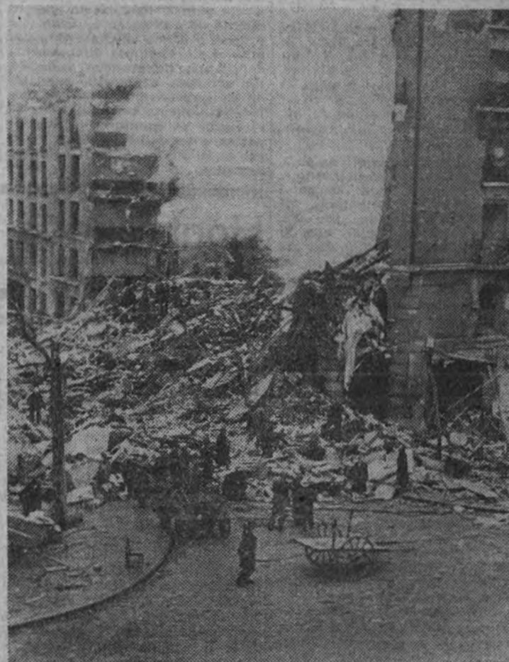
Una importante calle de París, convertida en escombros por el bombardeo de la Aviación británica.