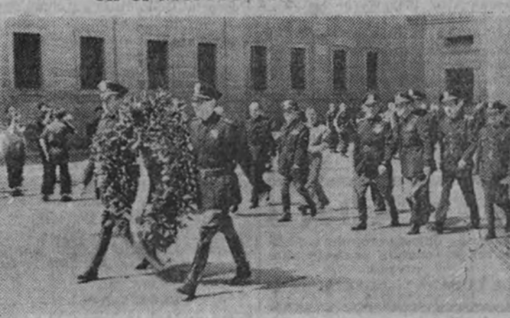
La Misión de la Artesanía Italiana rinde homenaje al Fundador de la Falange

Hoy se inaugurará una Exposición de Encajes en el Mercado de Artesanía