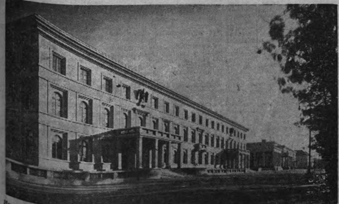
Hay se inaugura la Exposición de Arquitectura del Reich, instalada en el Palacio de Exposiciones del Reich. Figuran en la misma diversas maquetas y dibujos del nuevo estilo arquitectónico alemán, del que es buena muestra el magnífico edificio que reproduce nuestro grabado.

(Reportaje e información en tercera página.)