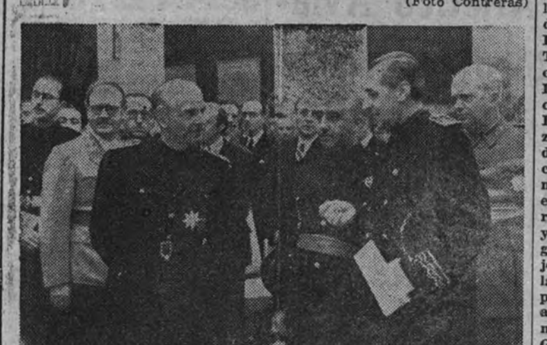
El Jefe del Estado, los ministros de Asuntos Exteriores y Gobernación y el embajador de Alemania, en una de las salas de la Exposición