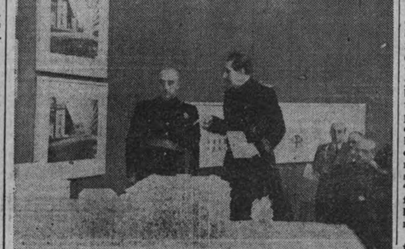
El Jefe del Estado examina una de las maquetas

Las principales personalidades que concurrieron al acto fueron: el ministro de Asuntos Exteriores, D. Ramón Serrano Suñer.