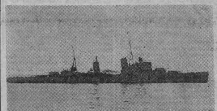
Un buque inglés de la clase del "Edinburg"

Los submarinos alemanes han hundido 22 mercantes en las costas americanas