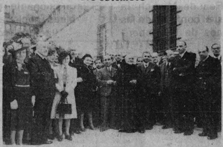
Grupo de congresistas asistentes a las Jornadas Médicas que se celebraron en Barcelona.