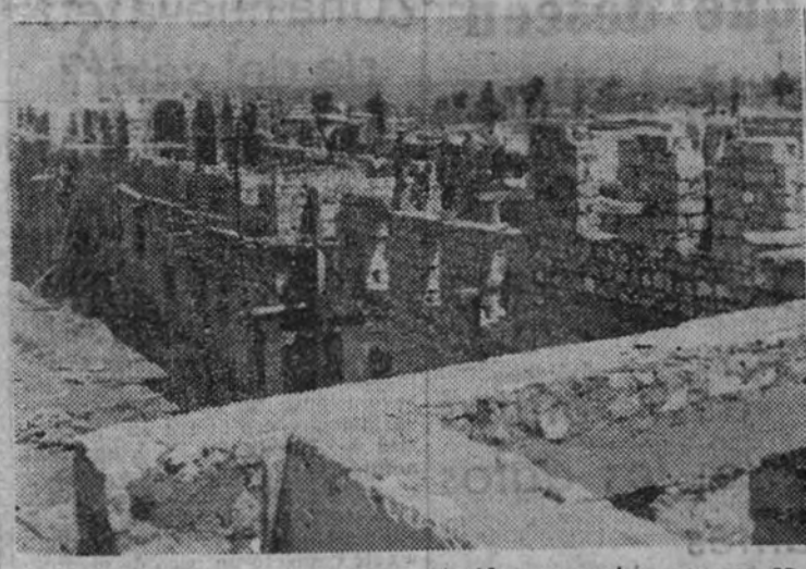
Vista de las obras de viviendas protegidas, cuyos terrenos son cedidos por el excelentísimo Ayuntamiento de Jaén.

ALMACENES PERALES PERFUMERIA — OBJETOS PARA REGALOS EXPOSICION PERMANENTE DE MUEBLES DE ACTUALIDAD. CERON, 8 JAÉN