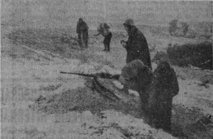
ataques eran cada vez más feroces; pero el inmenso espíritu, el heroísmo de los defensores surgía, con la consiguiente sorpresa de los rojos, de entre las piedras, de entre el fango, oponiéndose a su avance. Por primera vez hacían su aparición en aquel sector los carros de combate, en los que se apoyaba la infantería enemiga para su avance, y nuestras tropas curcían en absoluto de elementos para luchar contra los monstruos de acero; pero, a pesar de todo, los iban eliminando de la lucha por procedimientos primitivos, en los que el corazón lo suplía todo, y allí quedaban con su tripa hueca al aire, inútiles, envueltos en su caparazón terrorífico, que pronto no había de ser más que chatarra.

El Sr. Pombó habla también del perfeccionamiento en la fabricación de maquinaria eléctrica, que se ha logrado mediante la creación en España de la chapa magnética, aislantes y conjuntos de bolas, elementos de que carecíamos. Se refiere a la fabricación de tractores, agrícolas y máquinas, herramientas y elementos especiales para impulsar las industrias. En cuanto a la fuerza hidroeléct-