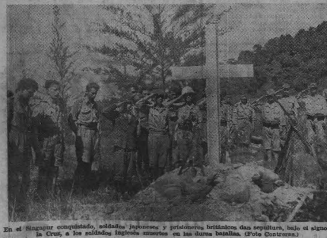
En el Singapur conquistado, soldados japoneses y prisioneros británicos dan sepultura, bajo el signo de la Cruz, a los soldados ingleses muertos en las duras batallas.