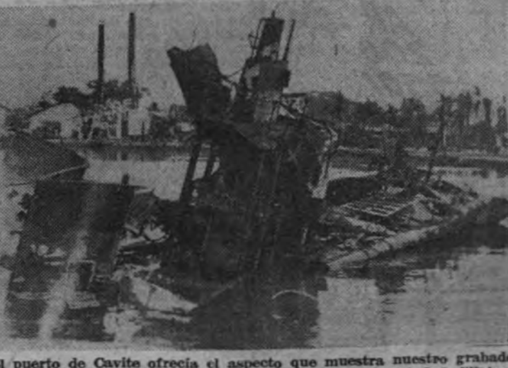
El puerto de Cavite ofrecía el aspecto que muestra nuestro grabado después de la entrada de las fuerzas niponas en la ciudad filipina.