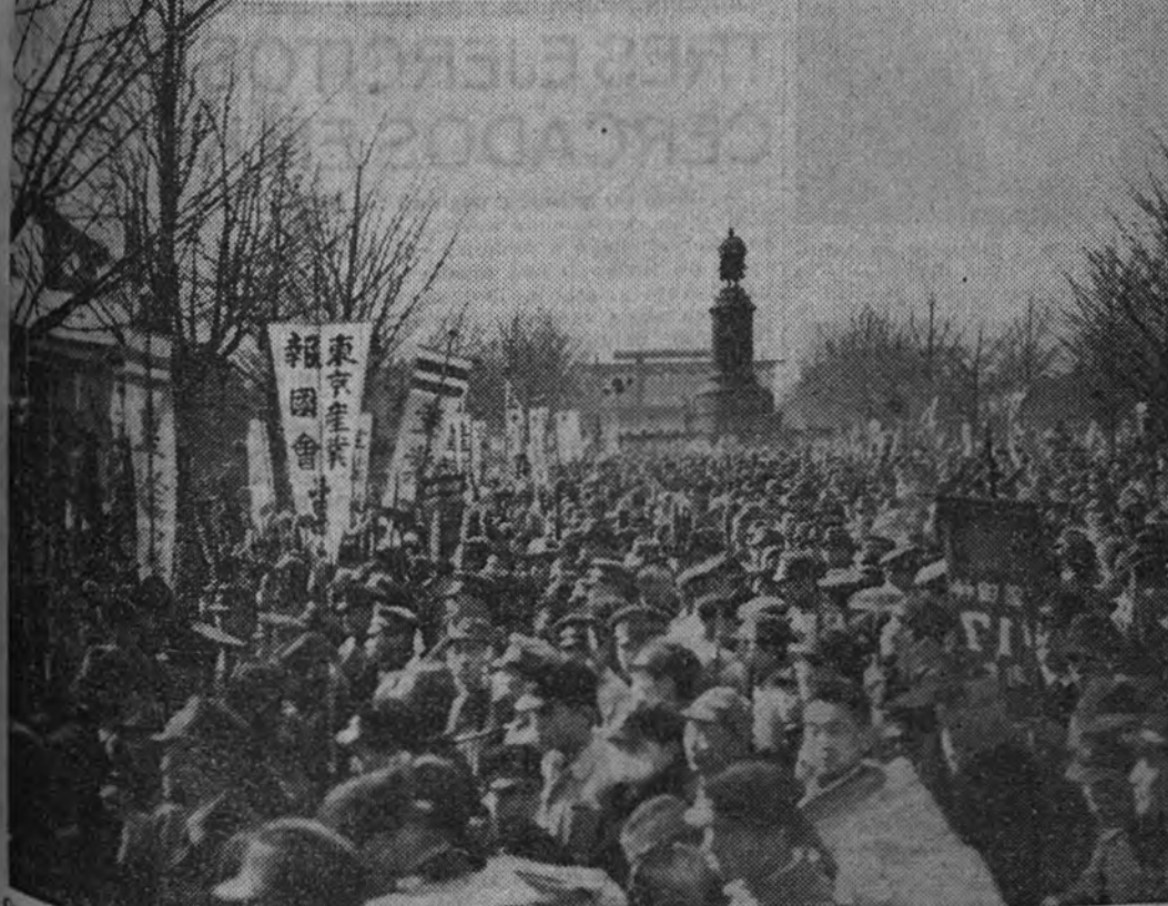
Con motivo de cumplirse el 2.602 aniversario de la fundación del Imperio, el pueblo de Tokio acude en manifestación ante el Palacio del Emperador.