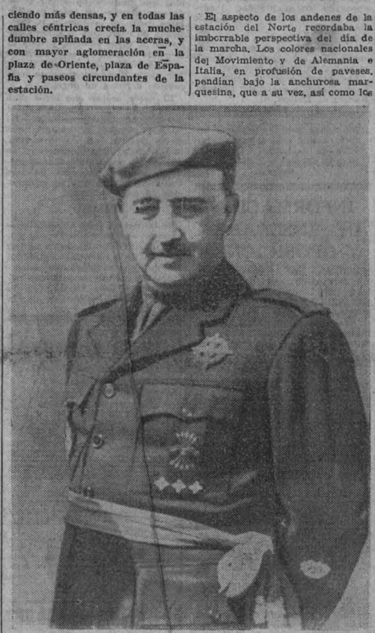
El Caudillo Franco, Jefe Nacional de la Falange, Generalísimo de los Ejércitos, vencedor del comunismo en la lucha que, comenzada en España, prosigue en Rusia los héroes voluntarios de la División Azul.