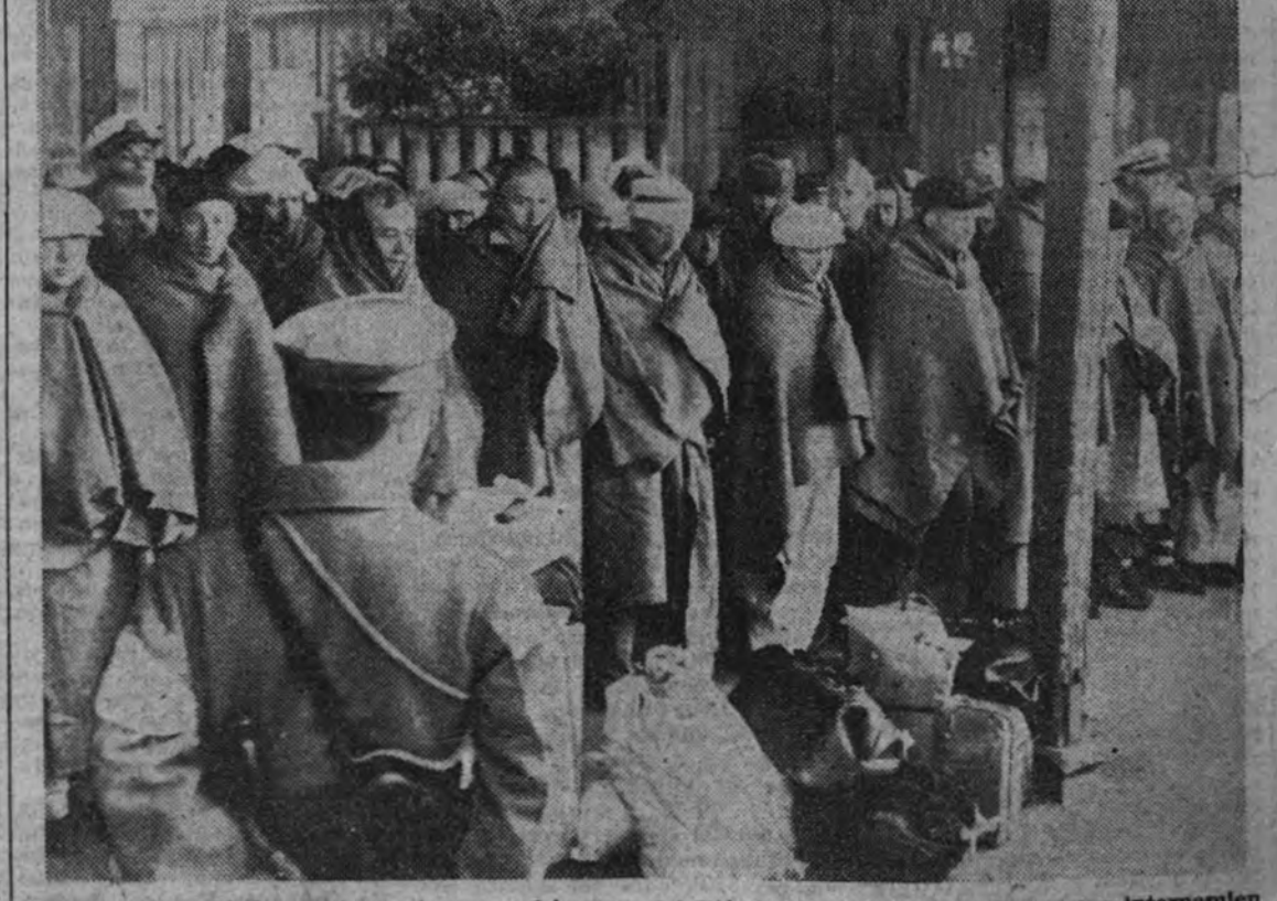
Un grupo de soldados norteamericanos, prisioneros del Ejército japonés, preparados para su internamiento en campos de concentración.