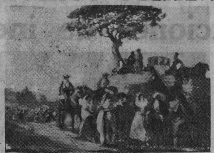
"El corregidor y la corregidora van de romería", por Hohenleiter

Francisco Hohenleiter se distancia, por su condición romántica, de las formas actuales de la pintura andaluza. Dentro de un estilo influido por Goya, y en el que se aprecian rasgos del costumbrismo ochocentista, actualiza el pintor la estampa de una Andalucía pintoresca, de bandidos románticos, de majas y de chisperos. La realidad se presenta a sus ojos con exclusivo carácter poético. Sobre un fondo de verdades cotidianas, el espíritu refinado del artista engalana con ropajes fortunyistas y goyescos las evocaciones del pasado. Esta mezcla de fantasía y precisión actual de las cosas otorga a su pintura una encantadora virtualidad. La idea de anacronismo pierde incluso su alcance ante la claridad de visión, el carácter esencial y la belleza de las imágenes. Ahora bien; este andalucismo, que se aparta de la manera en que ha derivado, desvirtuando la tradición pictórica local, elevado a otro plano estético alcazarista, sin salirse de su lenguaje dieciochesco o romántico, un grado de universalidad que hoy no tiene.