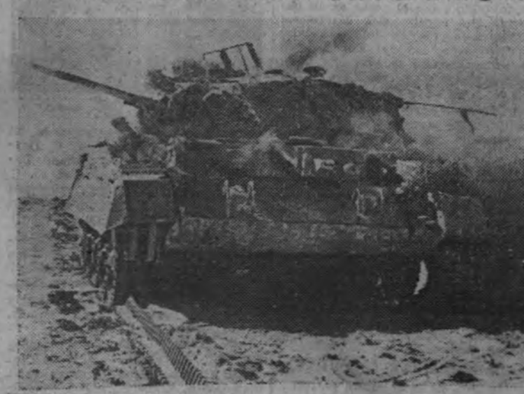
Un tanque inglés arde alcanzado por un impacto directo