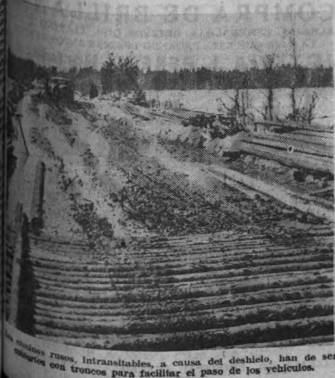
Los soldados rusos, intransitables, a causa del deshielo, han de ser transportados en troncos para facilitar el paso de los vehículos.