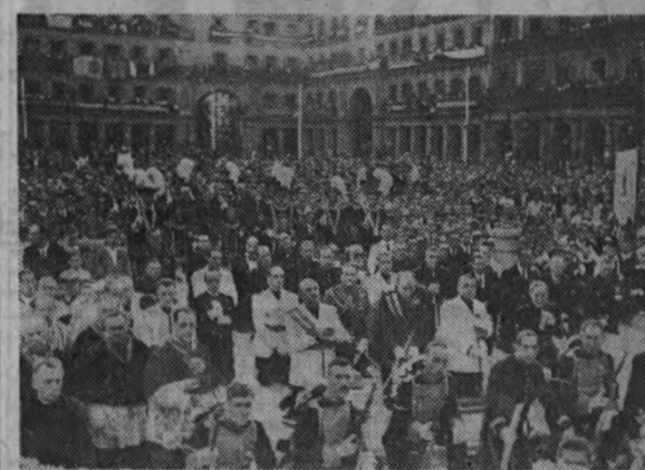
Las autoridades que presidieron la procesión

ESTAMBUL 4.—El "Tasviri Efkar" analiza en un editorial el alcance político del reciente acuerdo germanoturco, y dice que los amistosos sentimientos expresados por Hitler con respecto a Turquía en el mensaje dirigido al Presidente de la República turca no han sido palabras vanas. "El acuerdo proporciona hoy la ocasión de evocar la fraternidad — se dice en dicho comentario — de las armas germanoturcas en la guerra mundial; fraternidad que alienta en la actual amistad entre los dos pueblos." (Efe.)