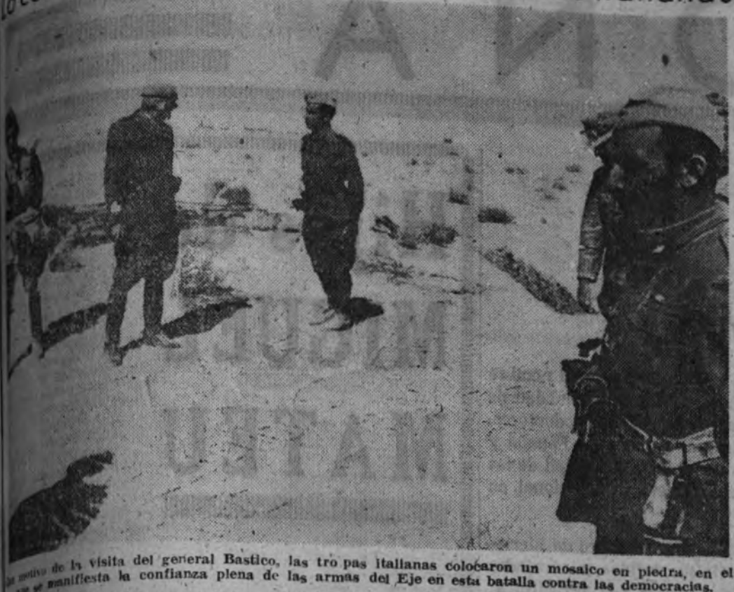
En la visita del general Bastico, las tropas italianas colocaron un mosaico en piedra, en el que se manifiesta la confianza plena de las armas del Eje en esta batalla contra las democracias.