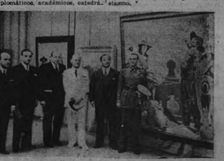
Los alumnos de la Asociación de la Prensa