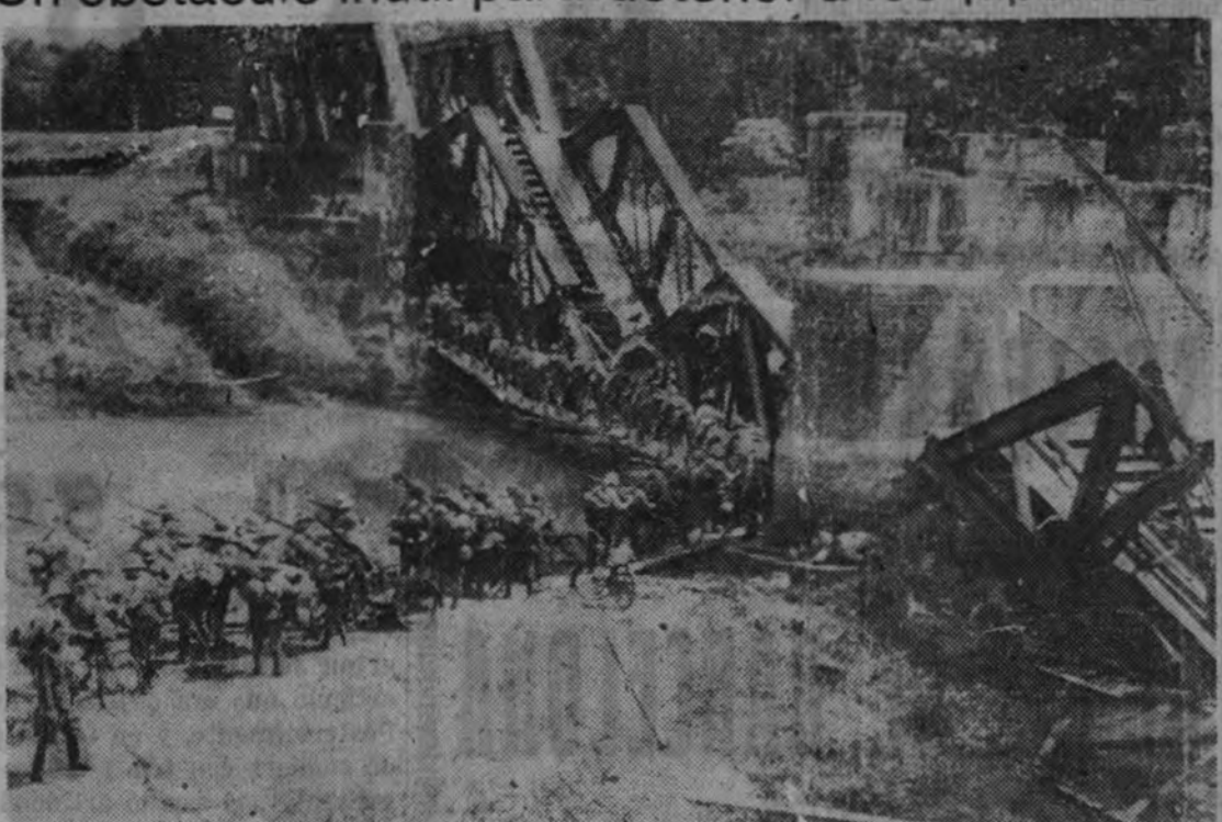
Los ingleses y los chinos destruyeron todos los puentes, en espera de detener el avance japonés, pero no les es muy difícil a los soldados nipones cruzar el río sobre puentes militares de madera.