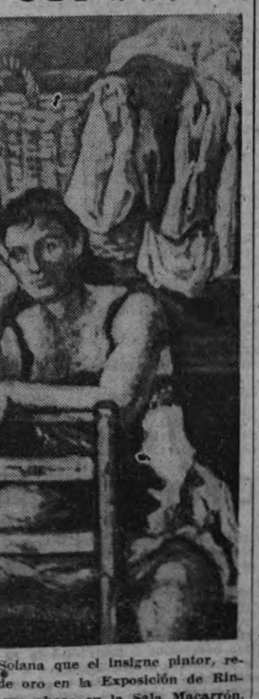
Exposición de Gutierrez Solana