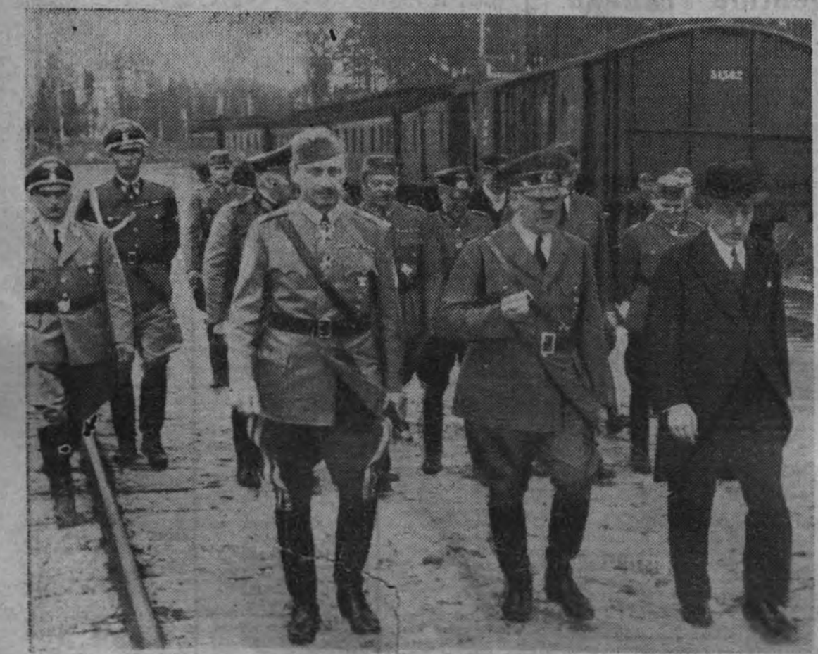
El Führer Canciller alemán, con el presidente finlandés, Risto Ryti, y el mariscal Mannerheim, durante la visita que recientemente hizo el jefe del Ejército finlandés en su cuartel general.