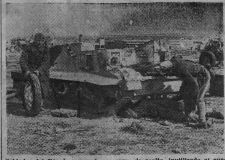
Soldados del Ejército desguazando un carro de asalto, inutilizado al enemigo, en servicio de recuperación para aprovechar sus piezas.