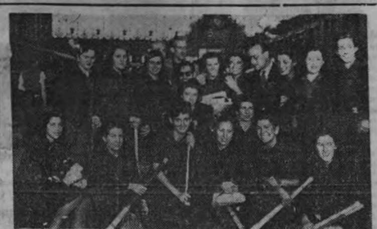
Las jugadoras del equipo nacional de hockey de la Sección Femenina han llegado ayer a Madrid. Juegan el día 18 de este mes, y la segunda, el día siguiente.