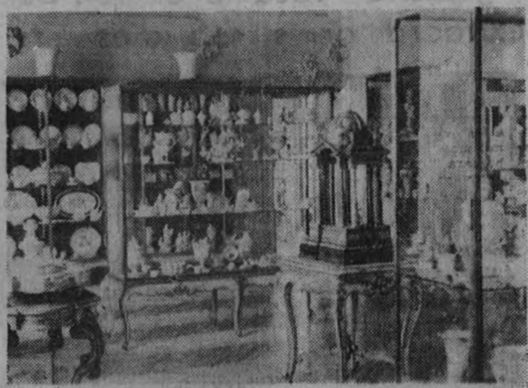
Aspecto de la sala de Porcelanas.

CASTELLÓN CELEBRA CON GRANDES FIESTAS EL ANIVERSARIO DE SU LIBERACIÓN CASTELLÓN 13. — Continúan las fiestas del aniversario de la liberación de la ciudad. A las seis de la tarde se ha celebrado el acto conmemorativo de la colocación de la bandera nacional por las fuerzas del Ejército en lo alto de la torre-campanario de Castellón, con asistencia de las autoridades civiles, militares y eclesiásticas y jerarquías del Movimiento, fuerzas de la guarnición con su banda de música, milicias del Frente de Juventudes y la Banda Municipal. Al izarse la bandera, las bandas de música ejecutaron el Himno Nacional y fueron voladas las campanas, mientras se escuchaban prorrumpir en grandes aplausos. A las siete de la tarde hubo un partido amistoso de fútbol, en el que venció el Castellón al Zaragoza por tres tantos a cero.