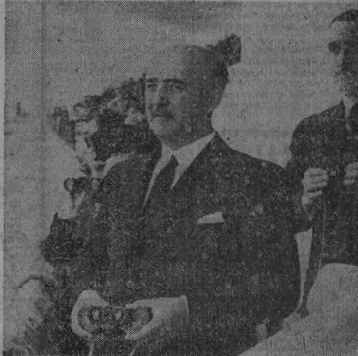
El Jefe del Estado sigue con interés el desarrollo de la carrera.

Con asistencia del Caudillo y con un lleno imponente se celebró el domingo, en el Hipódromo de la Zarzuela, la octava reunión de la temporada de primavera, en la que se corría el Premio de Su Excelencia el Generalísimo para toda clase de caballos nacidos y criados en España. En el papel aparecía esta carrera reñidísima, y ello llevó a numerosos aficionados deseosos de ver el resultado de la lucha entre los gallos de la generación de 1939, "Bot" y "Camprodón", que solamente diez días antes tan tenazmente habían luchado por la victoria en el Gran Premio de los Tres Años, y ahora, con una diferencia de kilos en favor del de la Yeguada Figueras, era interesantísimo ver el resultado. Primeramente se corrió una prueba de potros, que fué ganada con autoridad por el caballo del marqués de San Damián "Vendado".