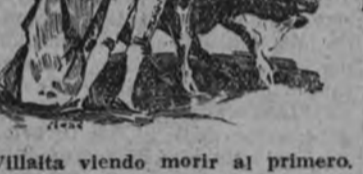
Villalta viendo morir al primero.