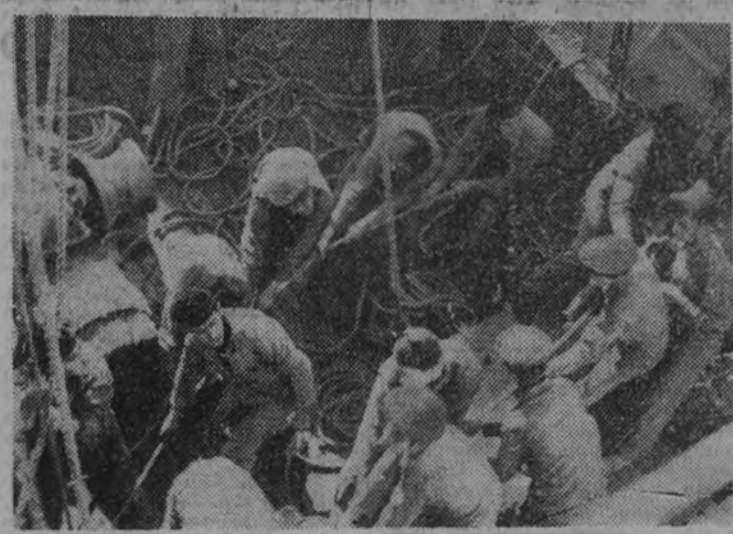
En las faenas de izar una vela.

En los comienzos de nuestra Cruzada, para dotar los escasos buques de que en aquellos momentos disponíamos, se reclutó perso-