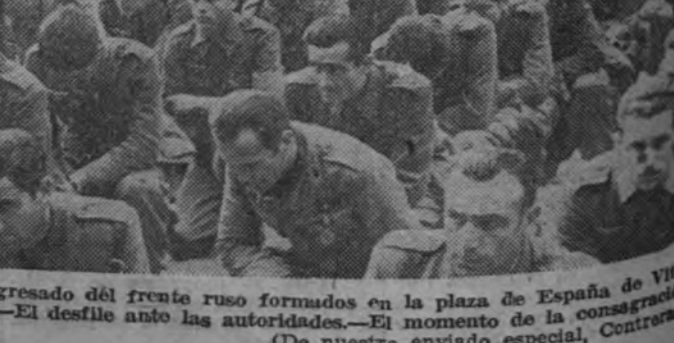
Los heroicos camaradas que han regresado del frente ruso formados en la plaza de España de Vitoria durante la celebración de la misa. — El momento de la consagración.