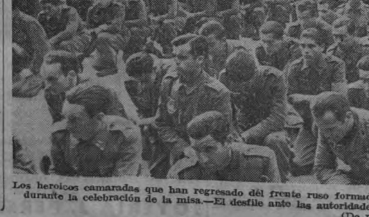
Los heroicos camaradas que han regresado del frente ruso formados en la plaza de España de Vitoria durante la celebración de la misa. — El momento de la consagración.

Ha hecho hoy dos años que España, convertida en mediadora, presidia el armisticio para Francia. Del armisticio no se acuerda nadie.