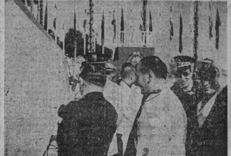
El ministro y jerarquías que le acompañan, examinando la obra de la nueva carretera Cádiz-Barcelona, cuyas obras acaba de inaugurar.

es una comunidad donde el hombre deja de estar aislado para ser un hombre político, cuyo esfuerzo se conjuga con el de los demás en la demanda de un fin común, ardientemente sentido.