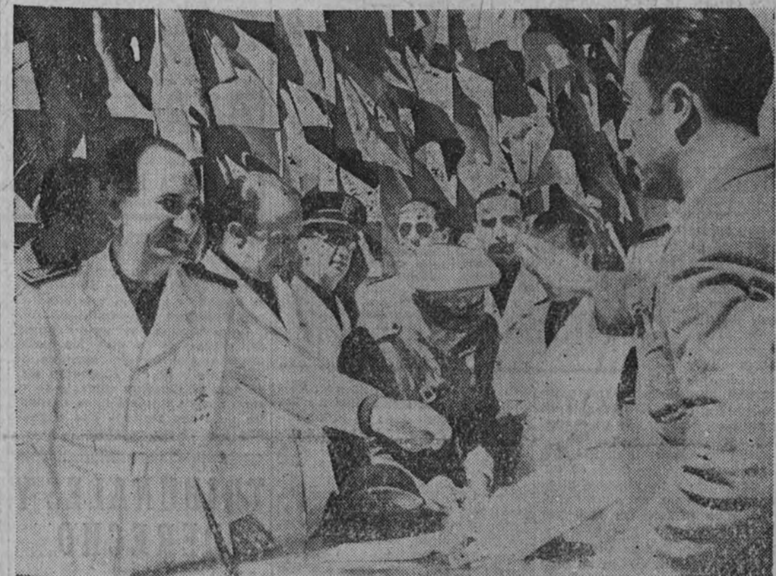
El ministro Secretario del Partido, camarada Arrese, haciendo entrega de las llaves de las viviendas a sus propietarios.