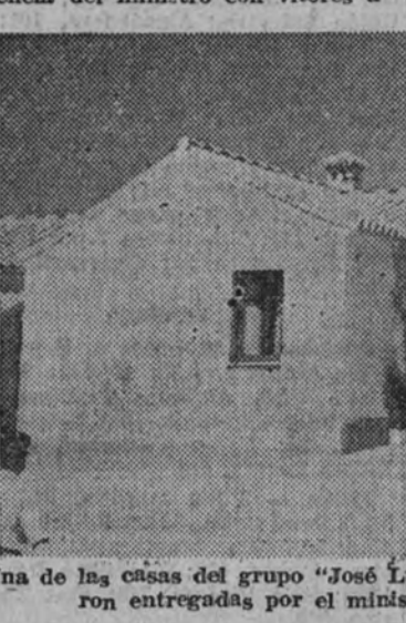
Una de las casas del grupo "José Luis Arrese", de las que ayer fueron entregadas por el ministro Secretario en Málaga.

En la Jefatura local, después de inspeccionar los distintos departamentos, el ministro recibió a las autoridades locales y a las comisiones de los pueblos de la comarca. La multitud estaba estacionada en la plaza requiera la presencia del ministro con vitores a España, a Franco y a la Falange.