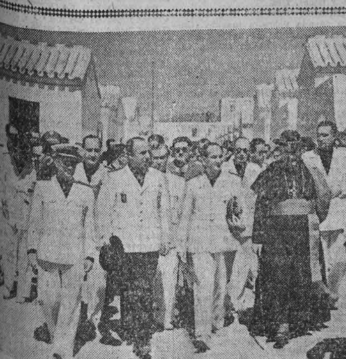
El ministro Secretario, camarada Arrese, en unión del obispo de la diócesis y otras jerarquías y autoridades, recorriendo la barrida antes de entregar las llaves de las nuevas viviendas a sus propietarios.

Cuando por una de sus más autorizadas voces la Falange convoca a todos los españoles a la gran tarea de la reconstrucción de España, que es la gran tarea de la Revolución nacional, rompe noblemente las insinceradas campañas enemigas. Nadie puede pensar que se pretende nada que sea ajeno a la grandeza, la libertad, la unidad de la Patria, porque no puede ser jamás objeto de falsificación la sangre de los muertos. Pero ante una empresa de tan gran volumen, de tan profundo empeño, de tan limpia aventura y de tan urgente necesidad, no puede haber oposición de nadie. La Falange—lo único vivo en el orden político que existe en la Patria—supone, con certeza, que en las oposiciones de esa clase se oculta la traición. Denuncia a sus autores como enemigos de España. Y jura firmemente, con la honda trascendencia que dio siempre a sus actos, que las suprimirá con la misma mano férrea con la que elevará a un pueblo al sitio universal que se merece.