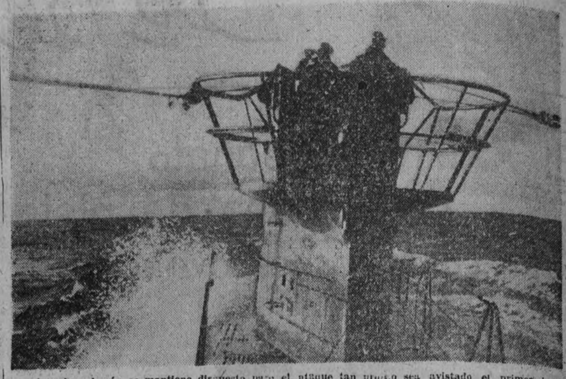
El submarino alemán se mantiene dispuesto para el ataque tan pronto sea avistado el primer buque enemigo.