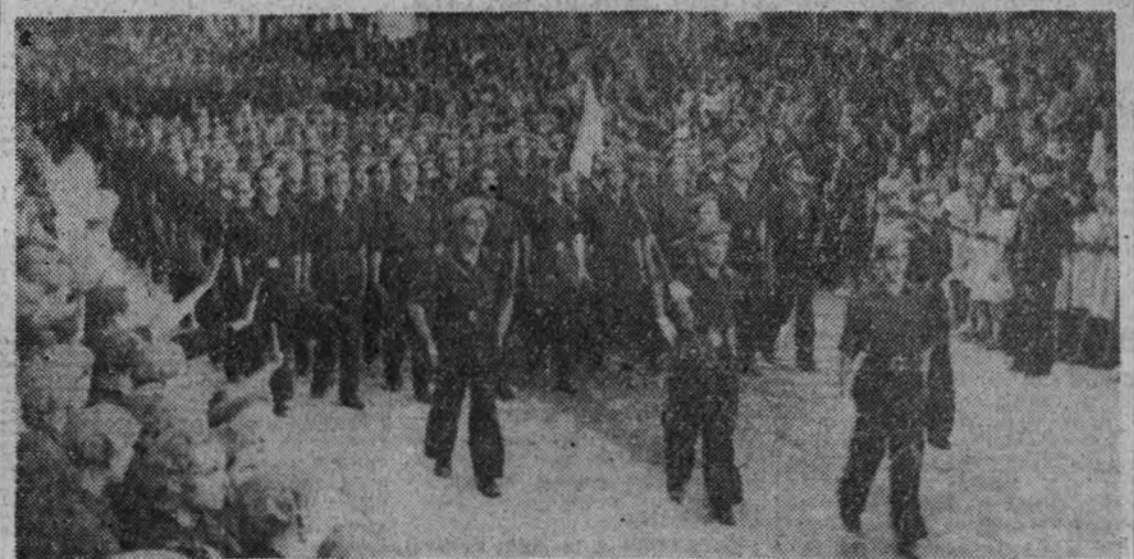
Desfile de la Falange de Almería. (Información gráfica de la Gestora Municipal.)

de operaciones locales, a las fuerzas enemigas; 118 refugios de cemento han sido capturados y un importante botín ha caído en poder de las tropas del Reich. Han fracasado los contraataques enemigos. En el frente de Volchov, las fuerzas adversarias cercadas han sido divididas en varios grupos, a consecuencia de un eficaz ataque. Es inminente el aniquilamiento de estas fuerzas. En el curso de reconocimientos aéreos sobre la bahía de Finlandia, la Aviación ha hundido un submarino enemigo y ha averiguado con bombas a dos pequeños mercaderes. Las fuerzas aéreas alemanas han efectuado ataques nocturnos contra las industrias de armamento situadas en el Voga superior y central, así como contra los objetivos ferroviarios de la región de Moscú. Del 12 al 22 de junio la Aviación soviética ha perdido 468 aparatos. (Continúa en última página.)