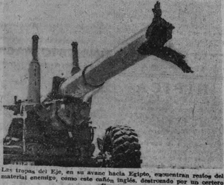
Las tropas del Eje, en su avance hacia Egipto, encuentran restos del material enemigo, como este cañón inglés, destruido por un certero disparo.

Su Alteza Imperial el Jalifa agradece al presidente de la Diputación valenciana las atenciones dispensadas durante su estancia en la ciudad