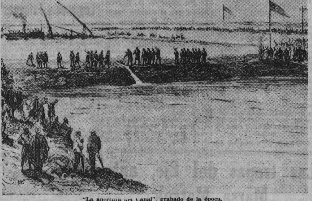
"La apertura del Canal", grabado de la época.