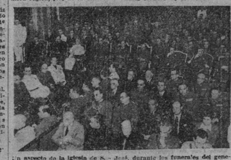
Un aspecto de la iglesia de S. José, durante los funerales del general Barrio.

Presidieron los ministros del Ejército y del Aire, acompañados por el subsecretario de la Presidencia, capitán general de la Primera región, jefe de la Casa mili-