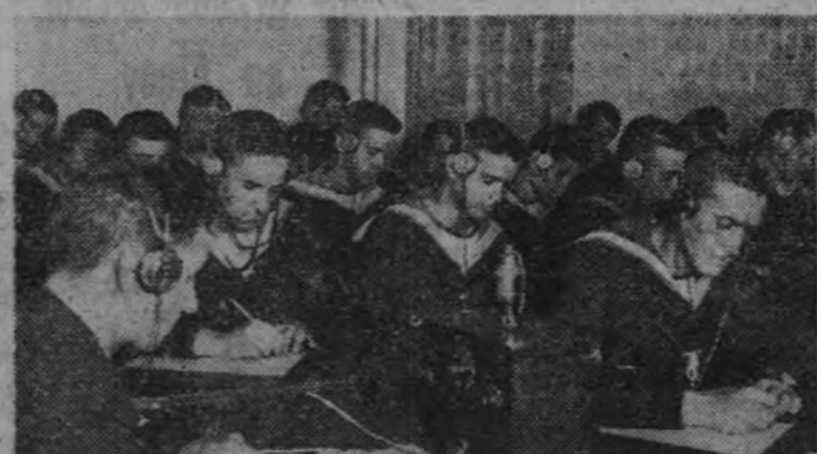
Aprendices de radiotelegrafistas haciendo prácticas

Para poder solicitar la asistencia a los cursos de la Escuela de Radiotelegrafistas o Electricistas de la Armada, es condición indispensable pertenecer a la marinería.