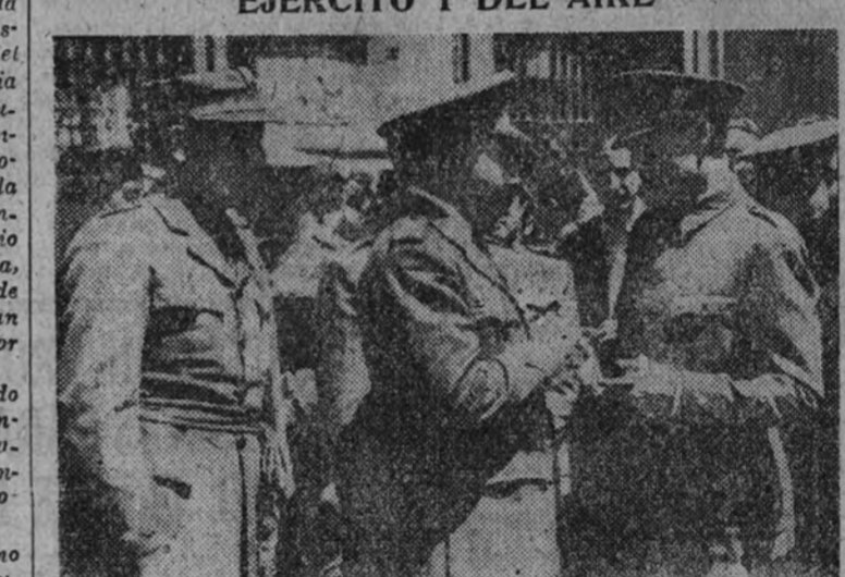
El ministro del Ejército, con los generales Asensio y Millán Astray, a la salida de los funerales por el general Barrio.

PRESIDIERON LOS MINISTROS DEL EJERCITO Y DEL AIRE