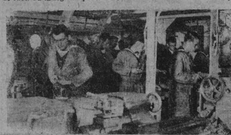
Aprendices de electricistas de la Armada trabajando en el taller

de aprendices se instaló en el "Navarra". Ahora acaban de terminar el curso la tercera promoción de radiotelegrafistas y la segunda promoción de aprendices electricistas. En Ríos no se hizo ningún curso para "electricistas".