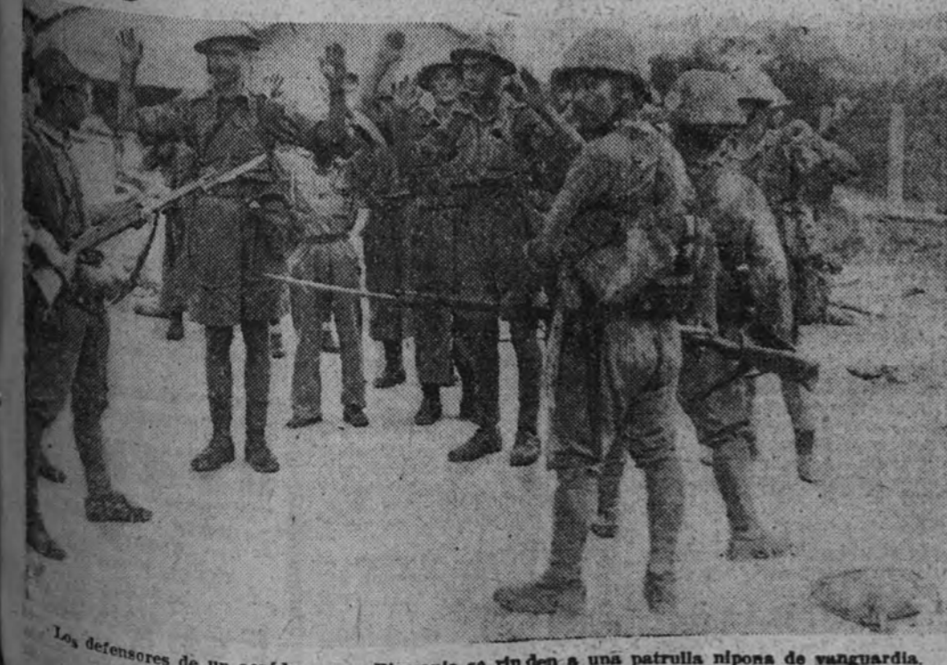
Los defensores de un aeródromo en Birmania se rinden a una patrulla nipona de vanguardia.