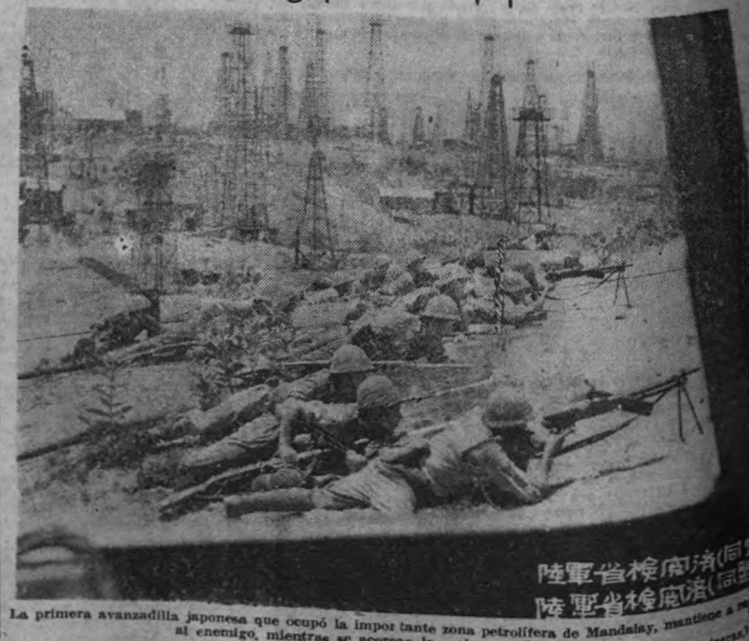
La primera avanzada japonesa que ocupó la importante zona petrolífera de Mandalay, mantiene al enemigo, mientras se acercan las columnas de refuerzo.