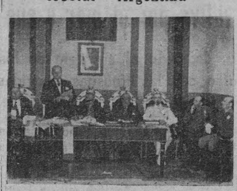
La presidencia del acto.