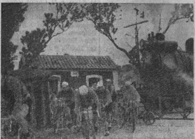
Ex-tampara pintoresca de la carrera. La lucha de los corredores con el paso a nivel. Los corredores más listos, forzarán el paso del tren sin detenerse, en busca siempre de la ventaja.

La etapa Luarca-Coruña se ha desarrollado con monotonía, sin que ninguno de los veintidós corredores que salieron de Luarca mostrase el menor deseo de rebatirse en la clasificación. Los corredores se apuraron a evitar que el hombre rápido en las llanuras se apurase otro triunfo para el día de hoy. El recorrido sufrió una pequeña modificación, a causa de la débil consistencia de algunos puentes. Hasta el control de Mondedero, a 100 kilómetros de la salida, la marcha ha sido lenta, sin que la jornada del estado del piso, que presentaba el menor bache. En el control de Delio, entra primero, y se adjudica la prima. Después de Mondedero intentan algunos escapados Thietard y Brambilla, pero son perseguidos inmediatamente y han de desistir. Estos corredores intentan animar la marcha con fugas, y en nada momento el aburrimiento que supone un grupo de hombres que caminan en apretado pelotón sin que ninguno de ellos se apure a escapar. Con gran retraso sobre el horario pasan por Betanzos: va en cabeza Thietard. Un pinchazo de Berrendero anima al pelotón en los últimos momentos de la etapa. Los últimos Jhabard, y pierde un minuto escaso. Thietard es de nuevo el hombre que consigue batir a Delio en la meta.