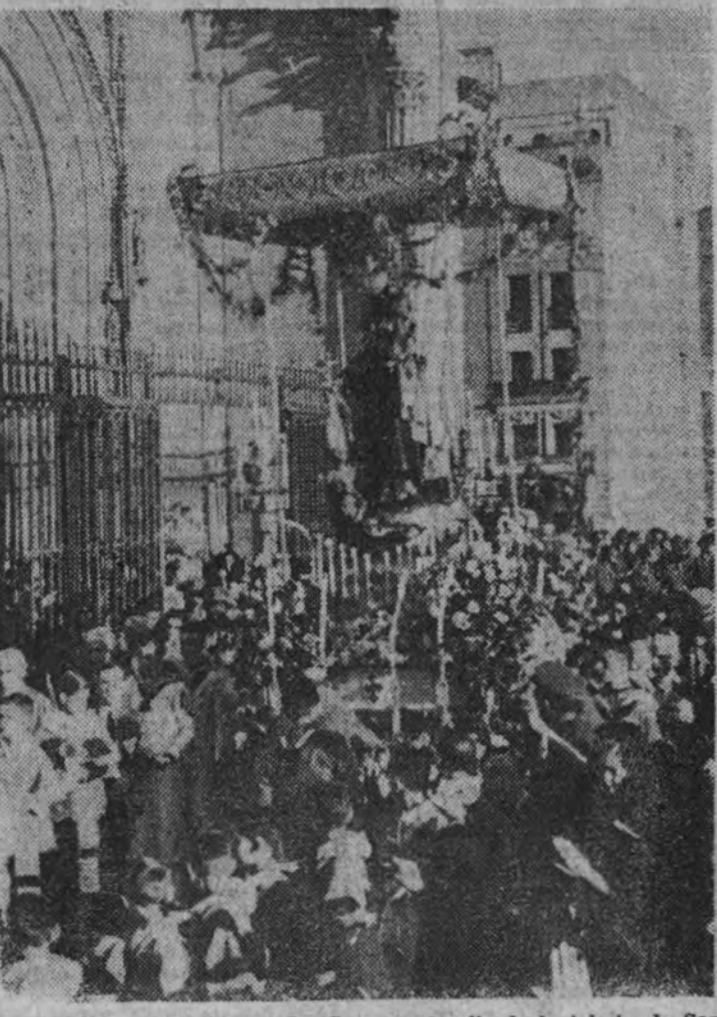
La procesión de la Virgen del Carmen al salir de la Iglesia de San Jerónimo.

Si eres falangista pon en tus cartas el sello "José Antonio"