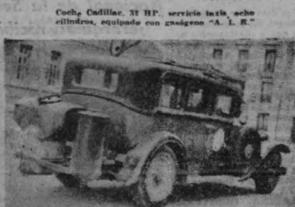
a GAS de leña y carbón

MADRID: Goya, 113. - BARCELONA: Provenza, 165