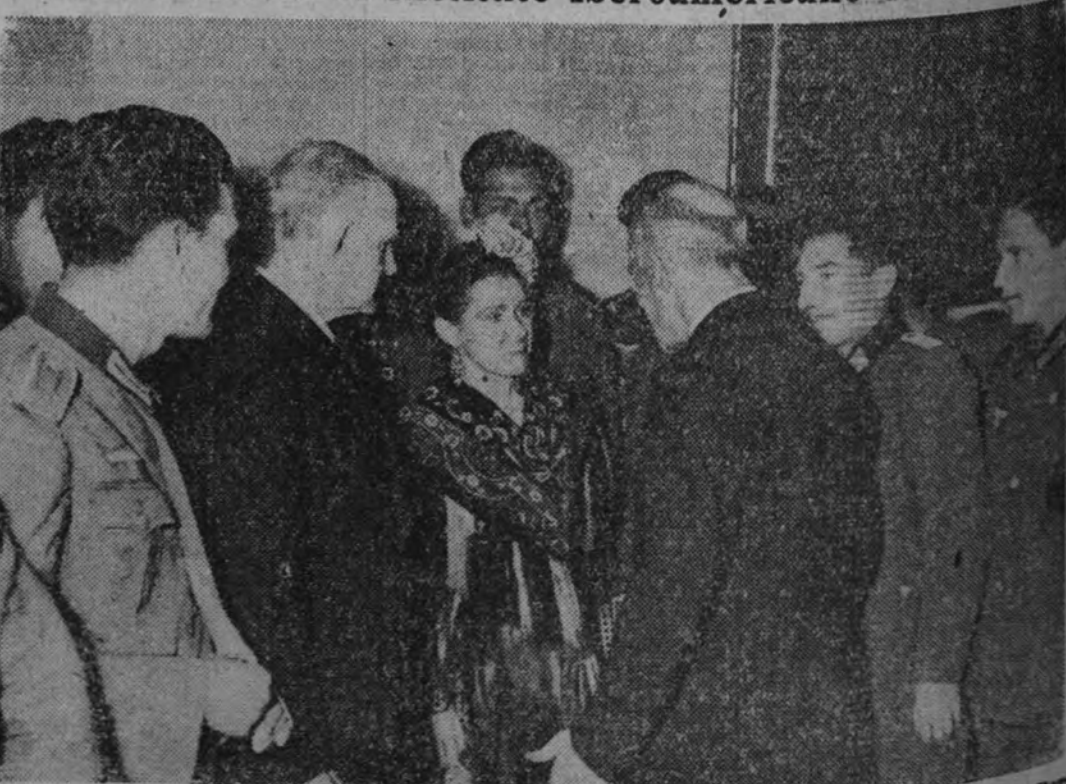
La Asociación germanoespañola celebró recientemente un festival en el Instituto Iberoamericano de Berlín, en el que participó la bailarina española Mariemma, y al que asistieron voluntarios de la División Azul.