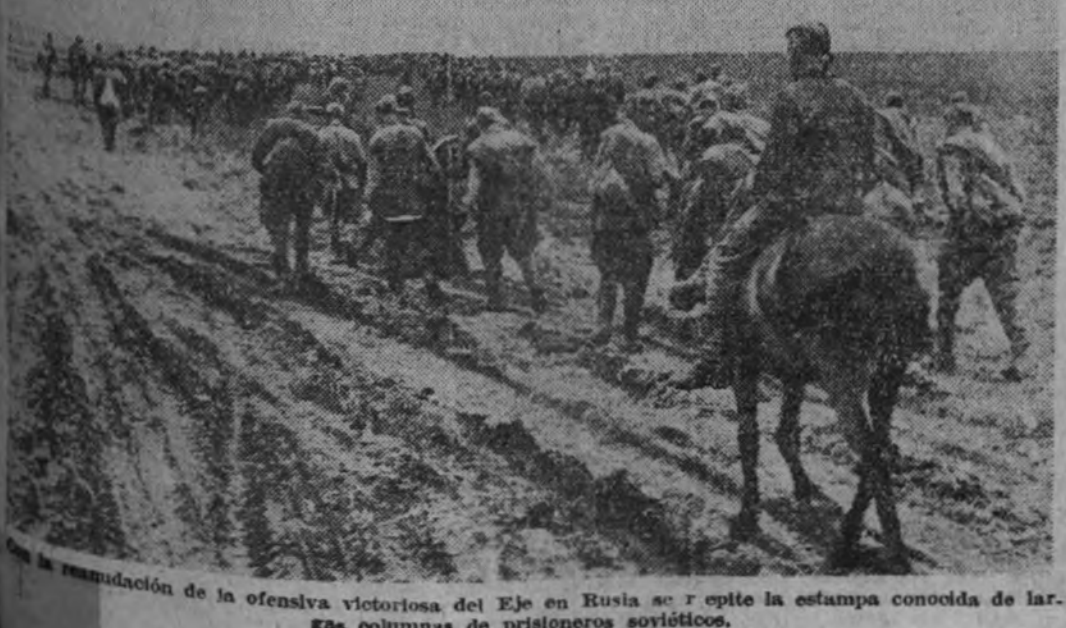
En la madrugada de la ofensiva victoriosa del Eje en Rusia se repite la estampa conocida de las columnas de prisioneros soviéticos.

El Asesor Nacional de Cultura y Arte del Frente de Juventudes dirigió la visita a las distintas salas de nuestra primer pinacoteca nacional, donde las jerarquías de