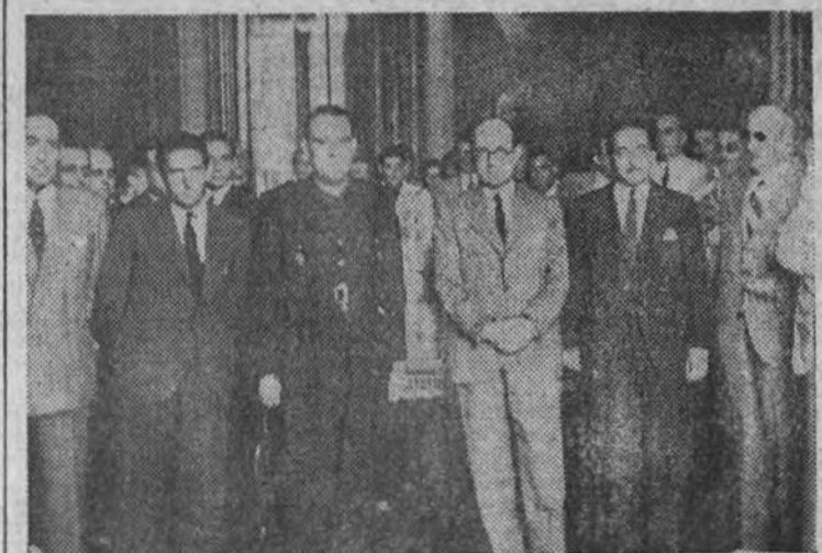
El ministro de Educación Nacional, en el acto de dar posesión al nuevo director general de Enseñanza Media.

Asistieron al acto los altos cargos del Departamento y los Claustros de los Institutos