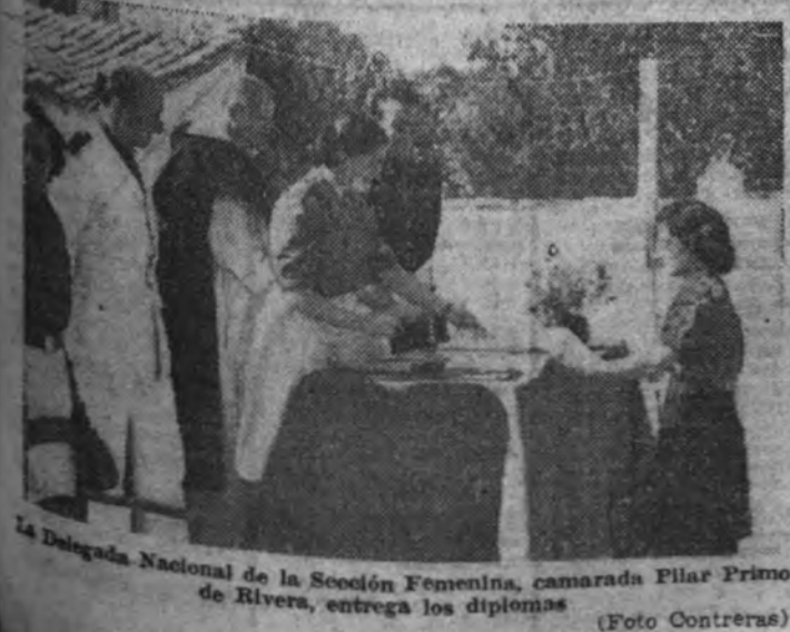
La Delegada Nacional de la Sección Femenina, camarada Pilar Primo de Rivera, entrega los diplomas

En la Escuela de Instrucción de la Sección Femenina de Falange Española Tradicionalista y de las J. O. N. S., y bajo la presidencia de Pilar Primo de Rivera, camarada de la Delegada Nacional, se clausuró el curso de Instructoras de Educación Física. La clausura se celebró en la mañana de ayer, a las once y media, en la Escuela de Instrucción de la Sección Femenina de Falange Española Tradicionalista y de las J. O. N. S.