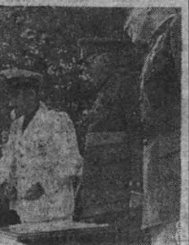
Los ministros Secretario General del Partido y de la Gobernación, en el momento de entregar los despachos a los nuevos alféreces

Los ministros Secretario General del Partido y de la Gobernación entregan los despachos a los nuevos alféreces