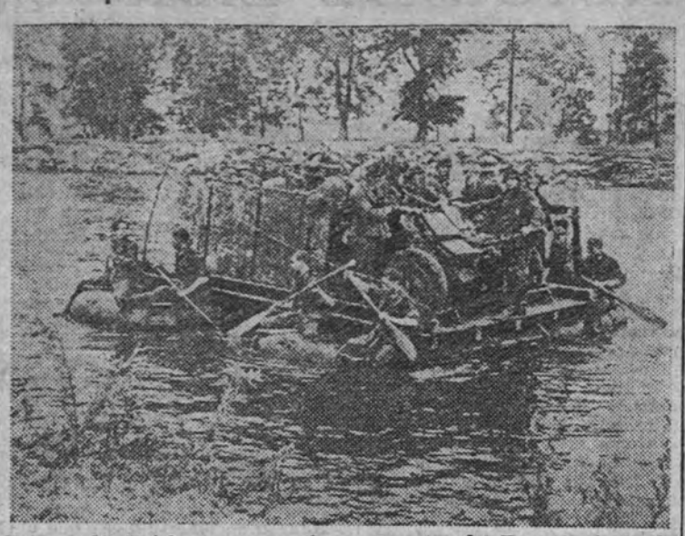
Fuerzas del Reich cruzan un río en el sector del Don, prosiguiendo así la persecución de los bolcheviques.