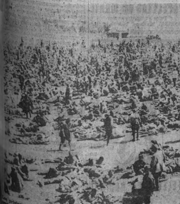
Concentración de prisioneros bolcheviques en el sector del Don

El nuevo Estado, sensible y fiel a su decidido propósito de elevar a todo trance el nivel de vida en el campo, que afrontó desde los primeros días de la guerra de Liberación la tarea de iniciar la reforma económica de nuestra agricultura, ordena hoy, en coordinación y consonancia con el régimen triguero instaurado por el Servicio Nacional, este procedimiento de fijación de rentas en los arrendamientos rústicos, que ha de ser clave resolutoria de situaciones de desahucio y de justa retribución al capital agrario.