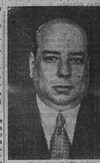
Don Antonio Ferro.

— Asistí — nos contesta el ilustre portugués — al incendio de España durante su guerra santa, y atravesé algunas veces en aquel período su Patria en llamas. Admiré el heroísmo de los soldados españoles, la calma y la fe de las poblaciones civiles, la impulsora exaltación de vuestras hermanas, de vuestras niñas, de vuestras madres; ¡tantas, España!, cuántas mujeres españolas! El grito de "¡Arriba España!" — un día se hará la maravillosa historia de este grito — me pareció la voz de nacimiento del alma misma de la raza, el ansia desesperada, heroica, de un pueblo que no quería perder su inconfundible fisonomía, que se agarraba a las sílabas de su propio nombre como al naufrago a la cuerda que constituye su última esperanza de salvación, el último asidero que le sujeta a la vida. Soy, por consiguiente, de los que pueden apreciar — mucho mejor que los propios españoles, que tie-