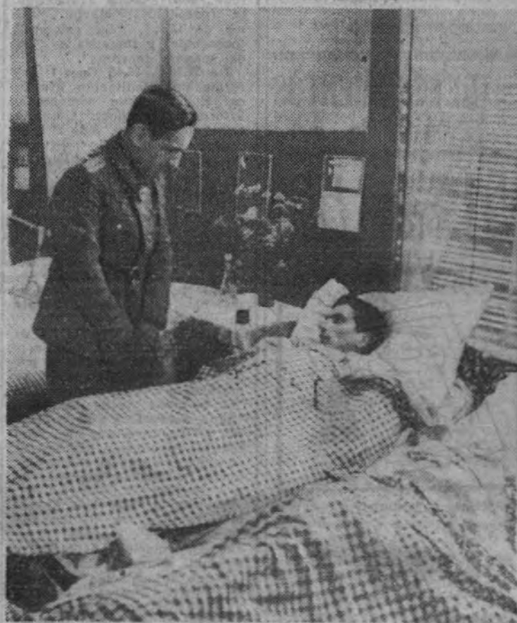
El heroico general Muñoz Grandes, jefe de la División Azul, visita en un hospital a los camaradas heridos en el frente de batalla.